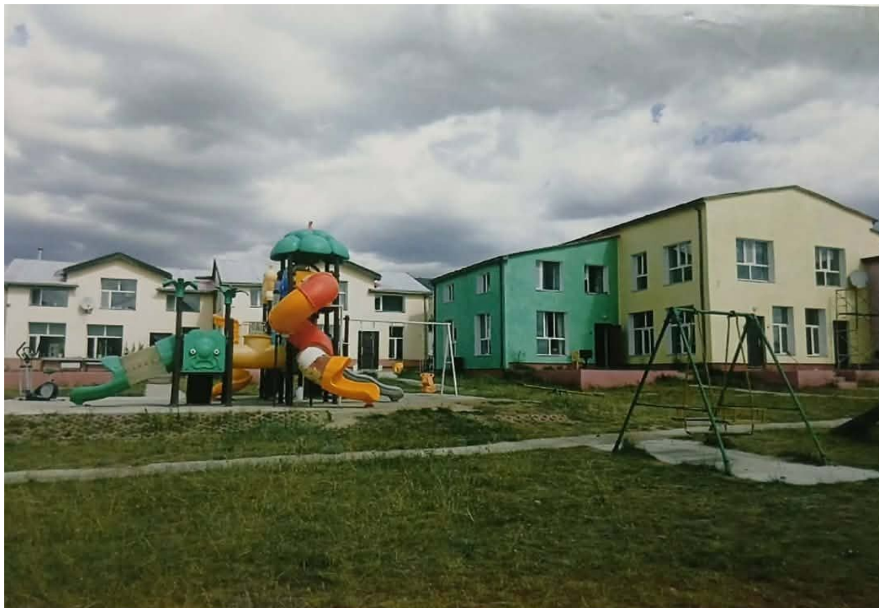
Зураг 2. Сагсны болон тоглоомын талбай