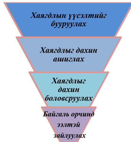
Зураг 10.1. Хог хаягдлын менежментийн үндсэн зарчим

Баруун наран төслийн хог хаягдлын менежментийн үндсэн зарчим нь дараах байдлаар тодорхойлогдоно. Төслийн хүрээнд хог хаягдлын менежментийг хэрэгжүүлэх зорилгоор Хог хаягдлын удирдлага, зохицуулалтын журмыг даган мөрддөг.