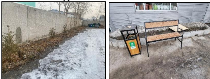
Зураг 7. Төслийн талбайн ногоон байгууламж болон орчны тохижилт