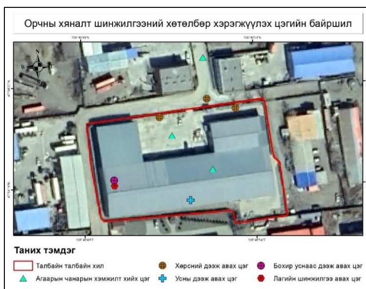
Зураг 18. Орчны хяналт шинжилгээний хөтөлбөр хэрэгжүүлэх цэгийн байршил

Хөрсний бохирдлын түвшинг дотоодын магадлан итгэмжлэгдсэн лабораториор гүйцэтгүүлэх, хяналт шинжилгээний хөтөлбөрт тогтоосон сорьц авах цэгүүд дээр үргэлжлүүлэх, сорьцын шинжилгээний төрөл хэлбэрийг орчны хяналт шинжилгээний хөтөлбөрт тусгагдсаны дагуу графикт хугацаанд нь хийлгэж дүгнэлт гаргуулж байх.