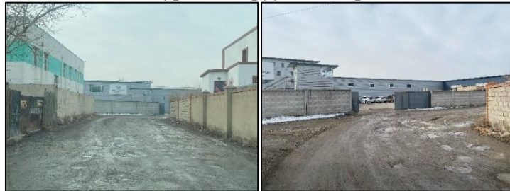
Зураг 5. Төвийн хатуу хучилттай замаас төслийн талбай хүртэлх шороон зам