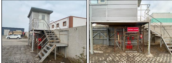
Зураг 4. Харуулын байр