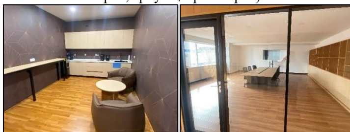
Зураг 9. Оффисын дотоод орчин