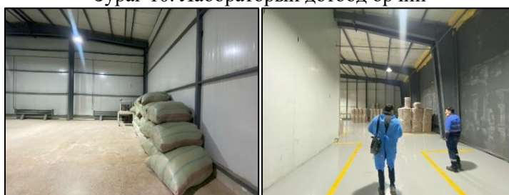
Зураг 11. Үйлдвэрийн агуулах