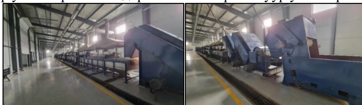
Зураг 14. Төслийн ноолуур угаах агрегат

Төслийн ноолуур угаах агрегат нь өдөрт 2.5 тн бохир ноолуур угаах хүчин чадалтай.