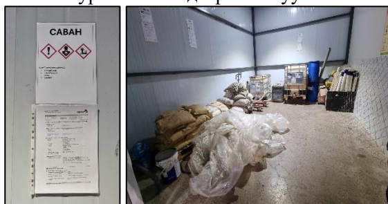
Зураг 12. Үйлвэрийн шингэн саван хадгалах агуулах