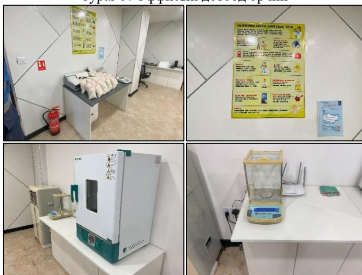
Зураг 10. Лабораторын дотоод орчин