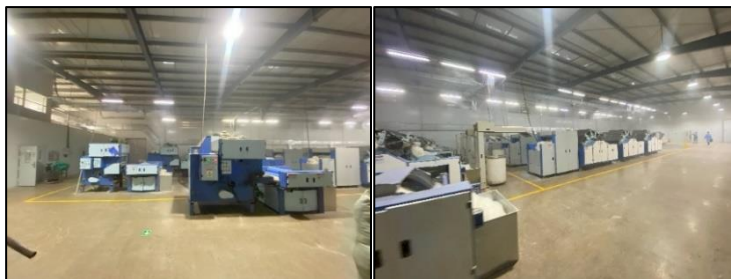
Зураг 15. Ноолуур самнах сүлжих хэсгийн тоног төхөөрөмж Төслийн цэвэрлэх байгууламж нь өдөрт 30 тн бохир ус цэвэршүүлэх хүчин чадалтай.