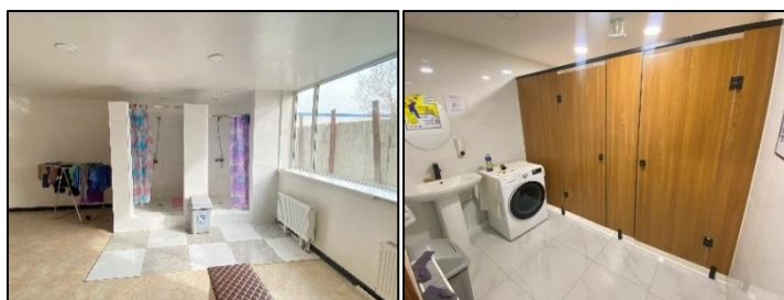
Зураг 8. Үйлдвэрийн дотоод орчин (утгах хэсэг, хоолны заал, ажилчдын хувцас солих өрөө, ариун цэврийн өрөө)