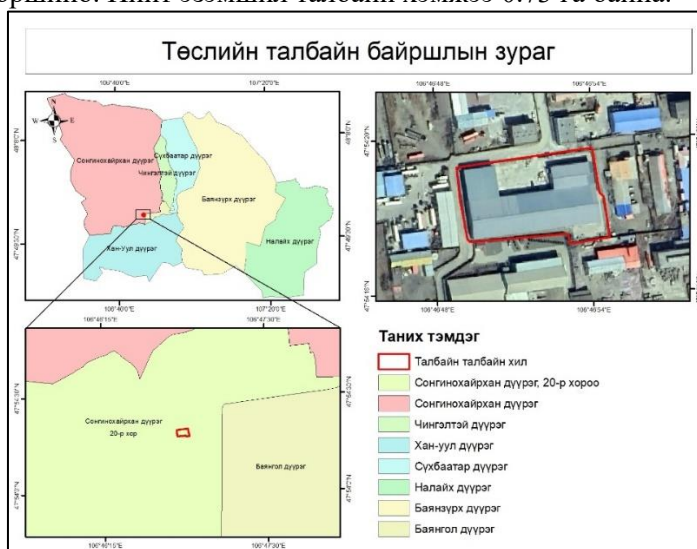
Зураг 1. Төслийн байршлын зураг

Тус ноос, ноолуур боловсруулах үйлдвэрийн 000017966 дугаар бүхий газрын гэрчилгээтэй талбай нь Улаанбаатар хотын Сонгинохайрхан дүүргийн 20-р хорооны нутаг дэвсгэрт оршино. Нийт эзэмшил талбайн хэмжээ 0.73 га байна.