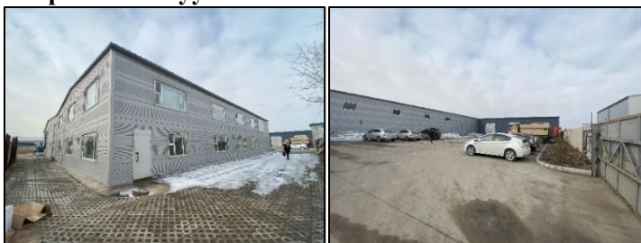
Зураг 2. Ноолуур боловсруулах үйлдвэрийн барилгийн гадаад орчин