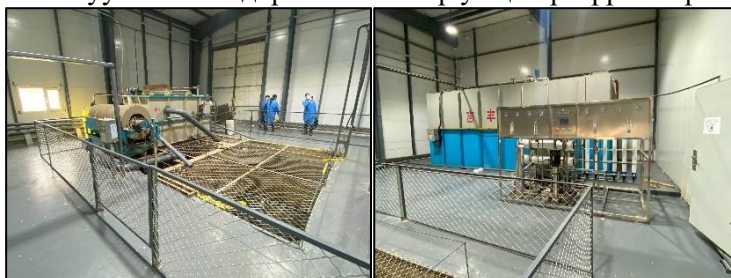
Зураг 16. Төслийн бохир ус цэвэрлэх байгууламж