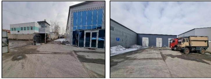
Зураг 3. Төслийн талбайн хатуу хучилттай авто машины зогсоол