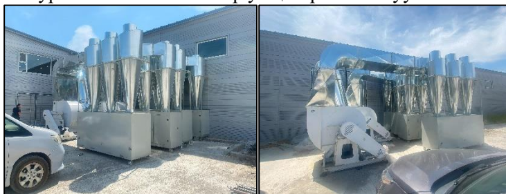
Зураг 17. Төслийн барилга байгууламжид суурилуулсан агааржуулалтын систем