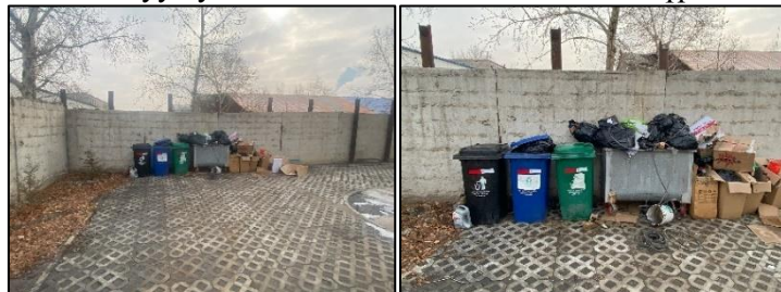
Зураг 6. Хог хаягдлын цэг