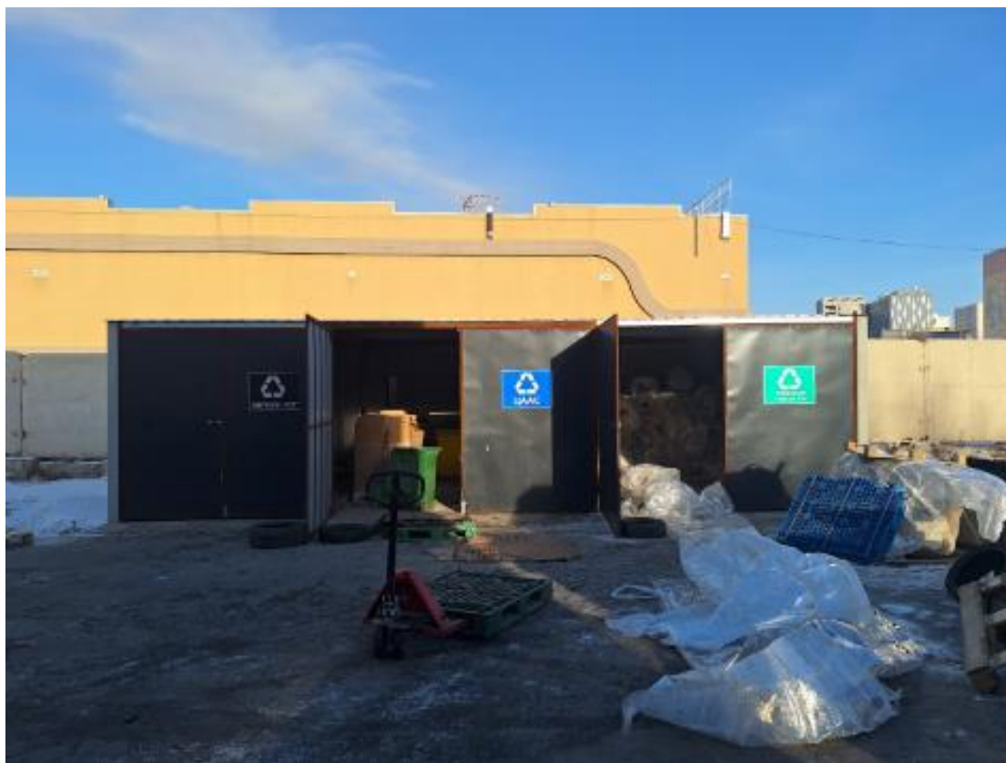
Зураг 2. Зориулалтын хогны сав