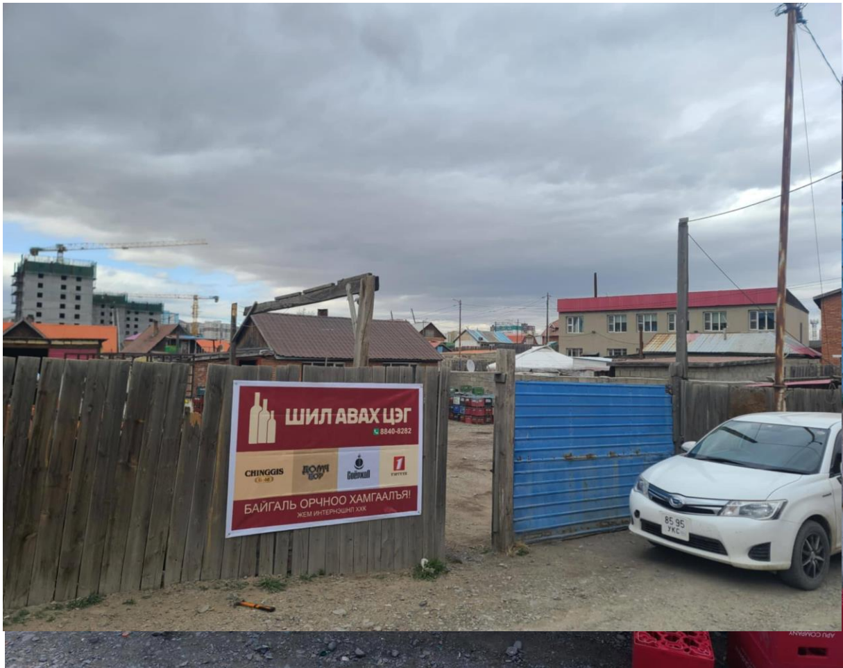
Зураг 13. Шил авах цэг