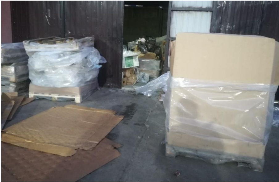
Зураг 3. Дахин ашигладаг хог хаягдал