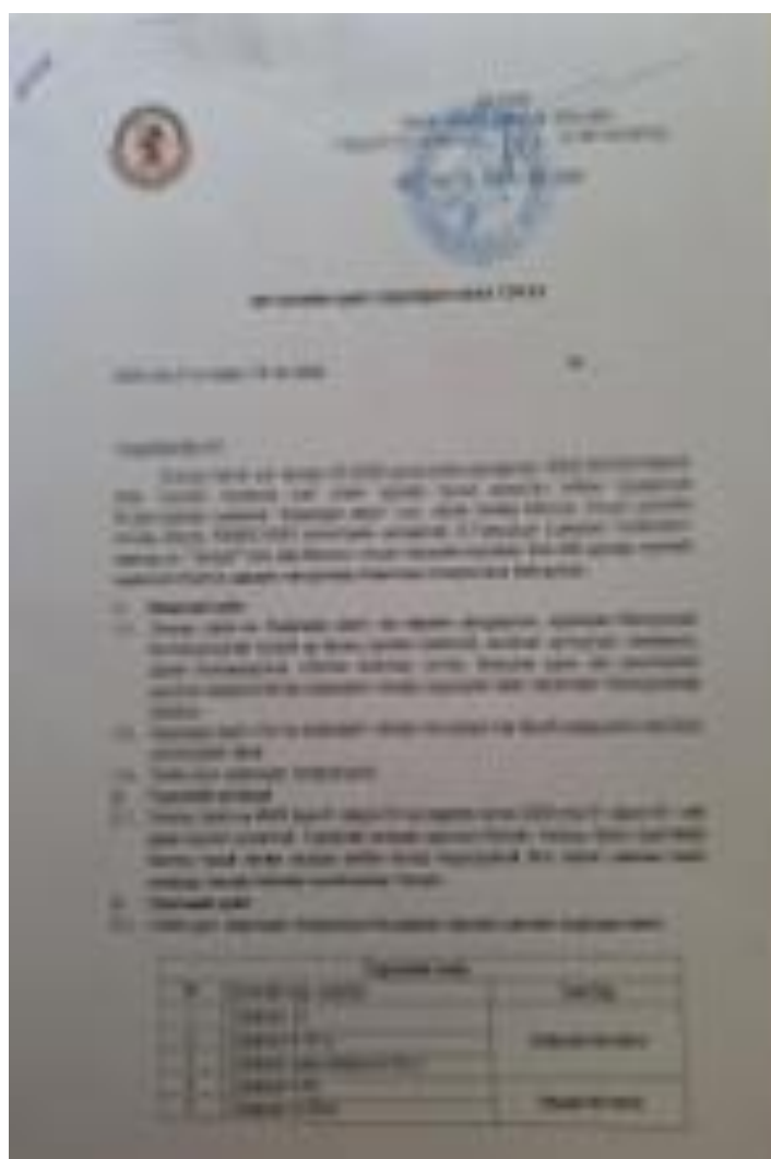
Зураг 10. Хаягдал шил авах гэрээ