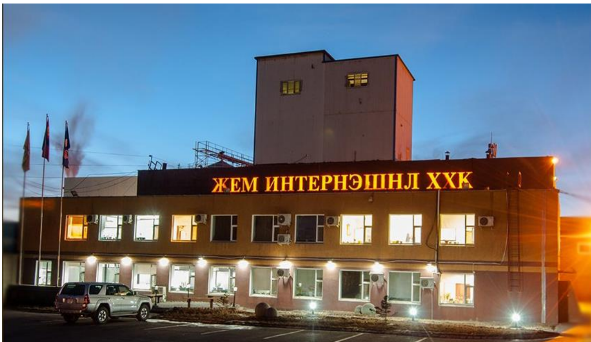
Зураг 1. Архи, шар айргийн үйлдвэр

Компаний засаглал, менежментийг улам сайжруулан Олон Улсын жишигт нийцүүлэн "Чанарын Удирдлагын тогтолцоо ISO 9001:2008", Кайзен, Борлуулалтын "Preselling" системүүдийг амжилттай нэвтрүүлэн ажиллаж байна.