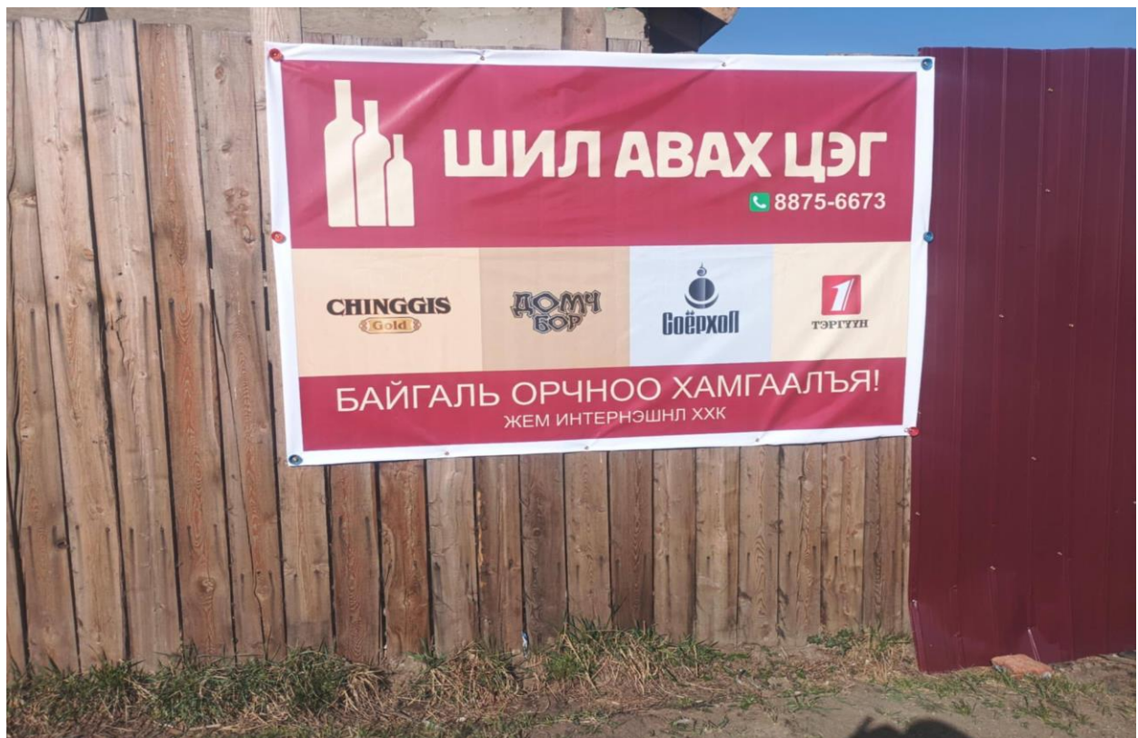
Зураг 14. Шил авах цэг