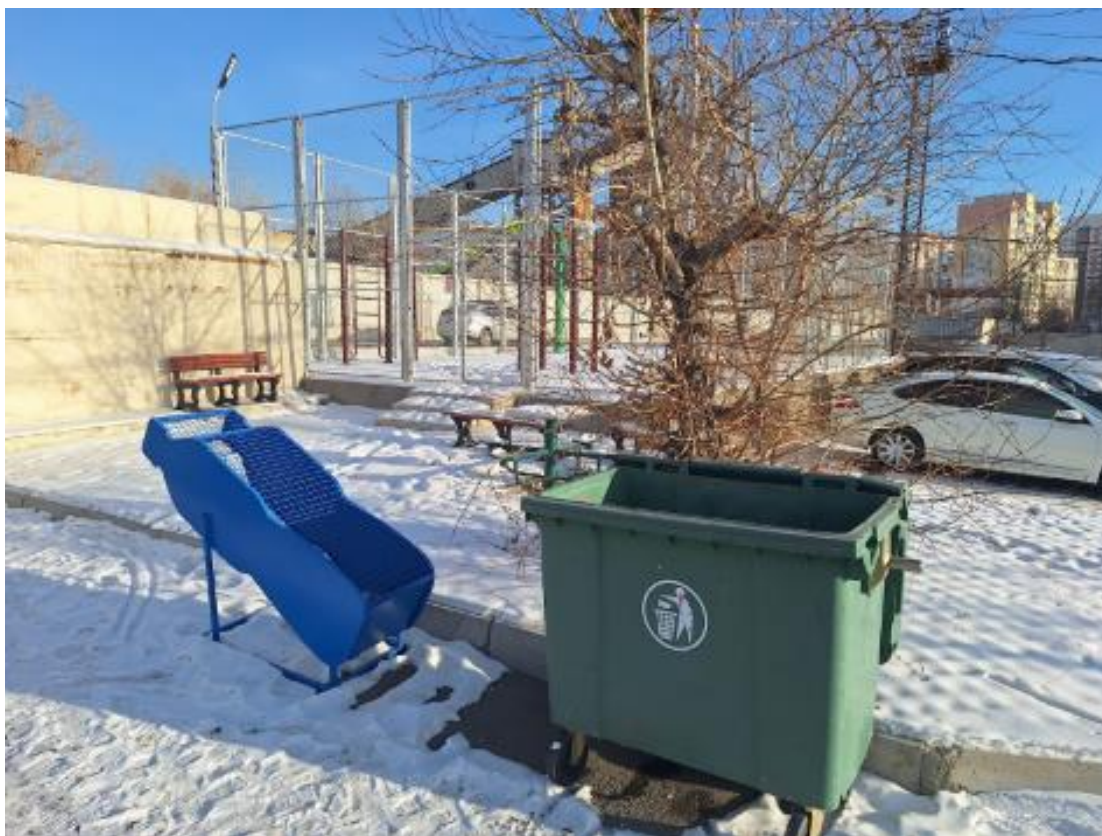
Зураг 1. Зориулалтын хогны сав