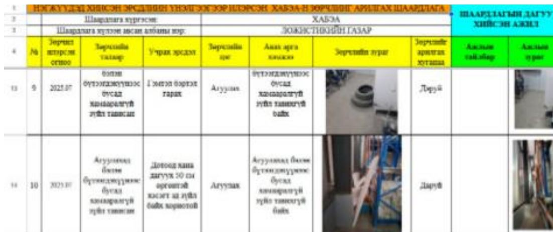
Зураг 4. Эрсдлийн үнэлгээний хүснэгт