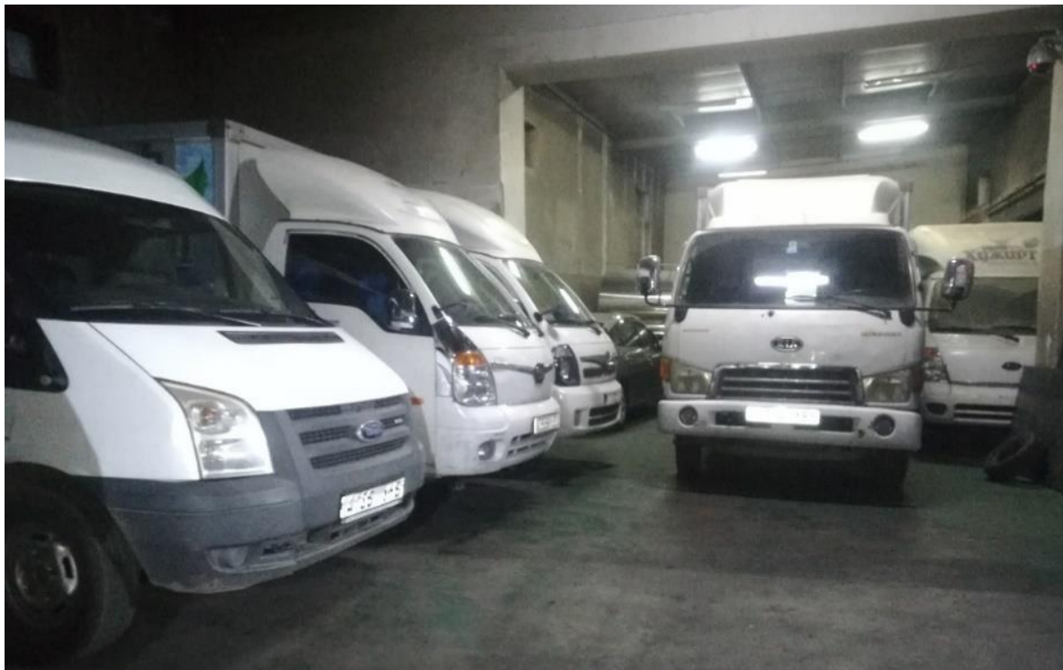
Зураг 5. Техник хэрэгсэл

Байгаль орчны бүрэлдэхүүн тус бүрээр авч үзвэл жишээ нь агаарын чанарт үзүүлэх гол сөрөг нөлөөллийн эх үүсвэрт түгээлтийн дизель 10 ачааны машин орно.