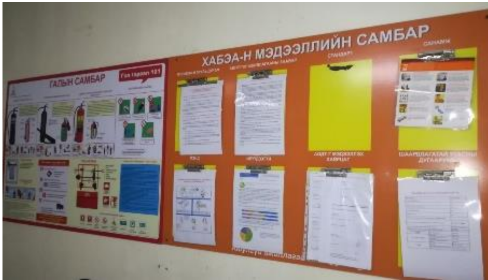
Зураг 3. ХАБ-н мэдээллийн самбар