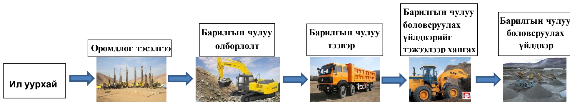
Зураг-1. Тоног төхөөрөмжүүдийн холболтын бүдүүвч