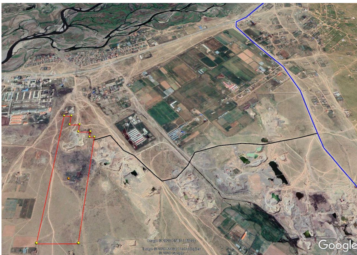
Зураг 3. Замын трасс