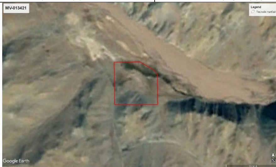
Зураг 1. Төслийн талбайн байриил