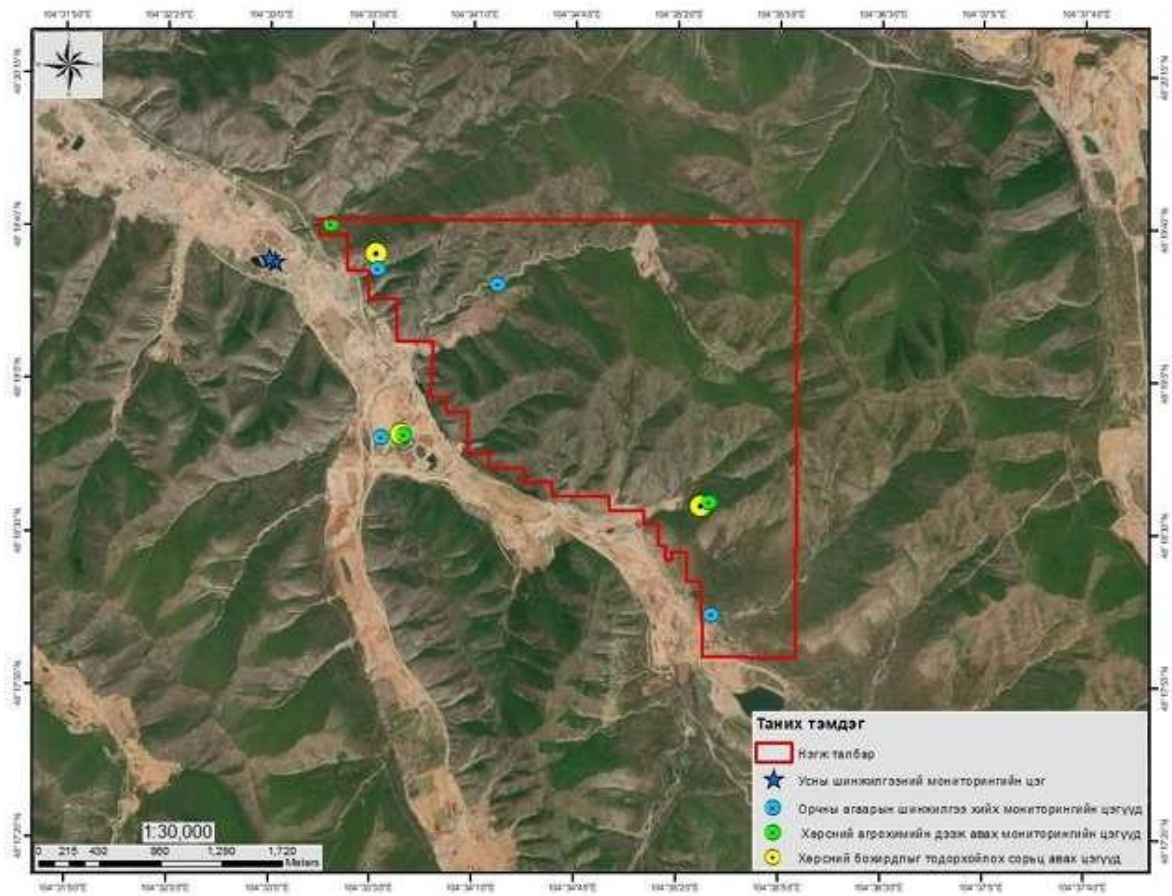
Зураг 2. Орчны хяналт шинжилгээний хөтөлбөрийн мониторингийн цэгүүд

Монгол Улсын Байгаль орчныг хамгаалах тухай хууль, байгаль орчинд нөлөөлөх байдлын үнэлгээний тухай хууль, засгийн газар, БОНХЯ болон бусад холбогдох газруудаас гаргасан зохих заавар, журмын дагуу “Санжидын ам, Халзангийн ам” нэртэй алтны шороон ордыг ил аргаар ашиглах төслийн 2026 оны уулын ажлын төлөвлөгөөтэй уялдуулан боловсруулав