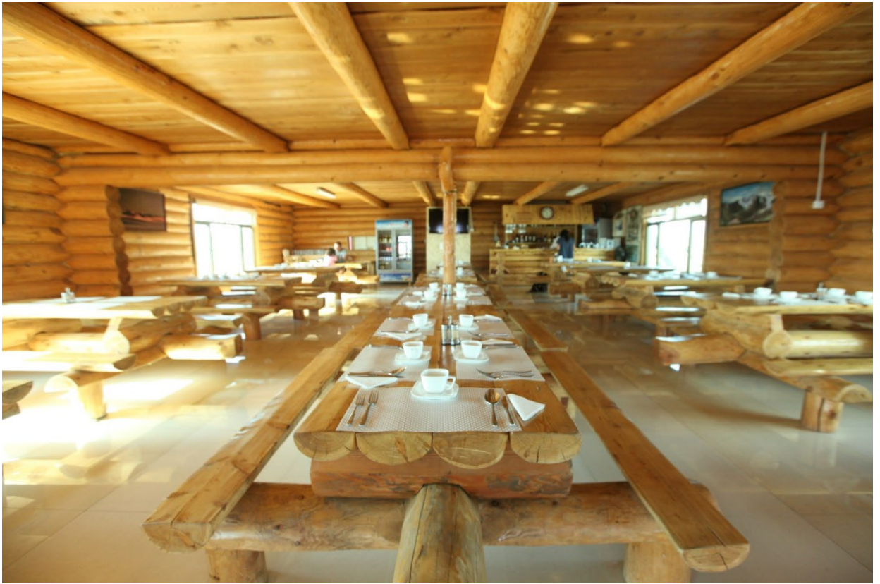
Жуулчны баазын ресторан