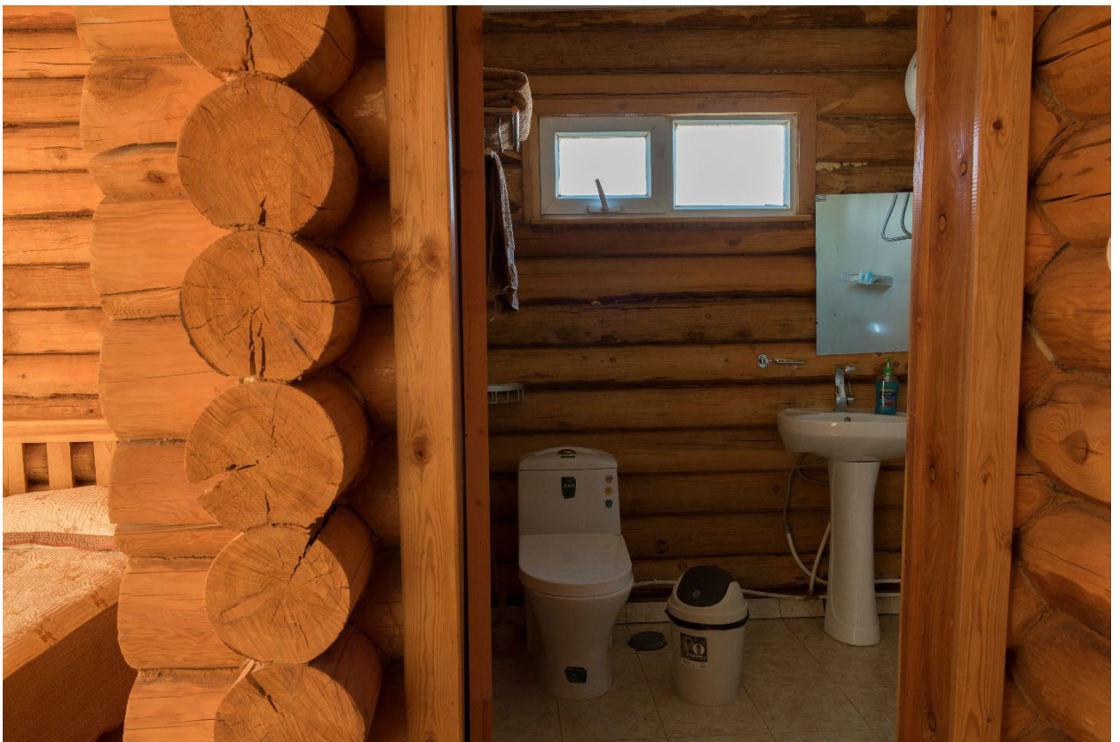
Жуулчдын амрах дүнзэн байшин