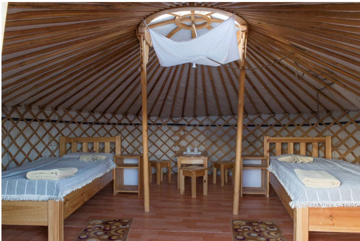
Жуулчдын амрах гэрийн доторх байдал