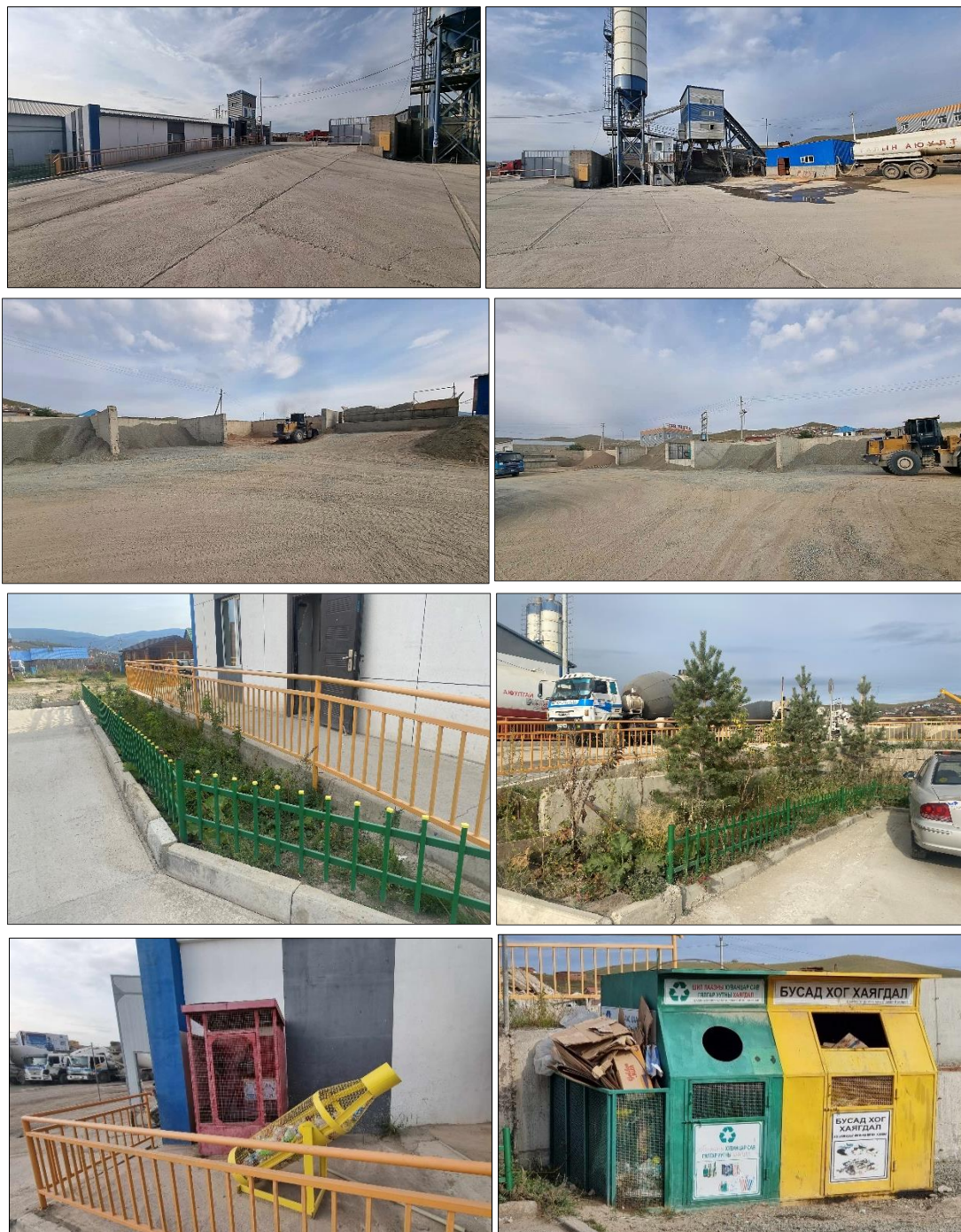
Зураг 3. Төслийн талбайн орчин