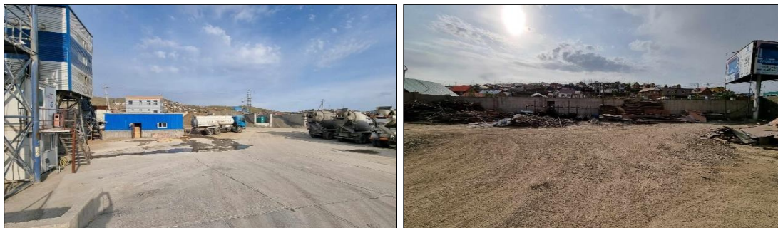
Зураг 5. Үйлдвэрийн хашаан доторх газрын гадаргын төлөв байдал

Бетон зуурмагийн үйлдвэрийн төслийн эдэлбэр газрын хэмжээ 1.2 га бөгөөд талбайг хатуу хатуужилтай болгосон байна.