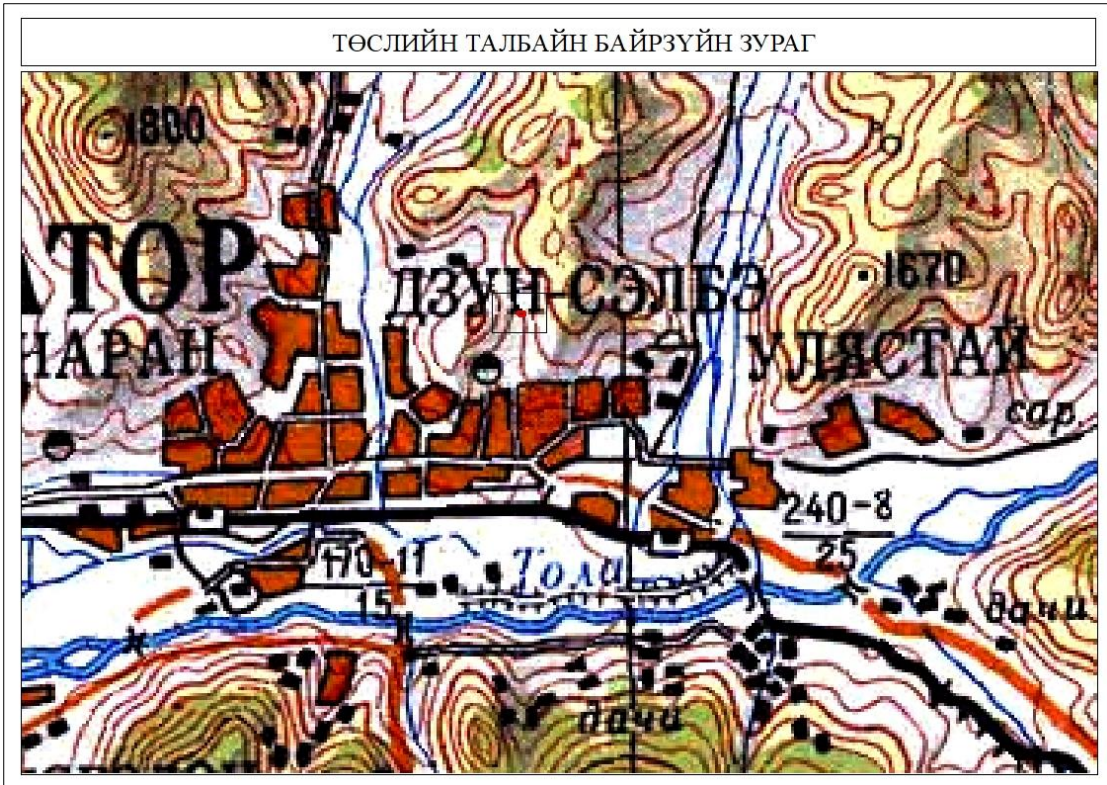
Зураг 2. Байрзүйн зураг