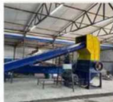
Хуванцар дахин боловсруулах үйлдвэрийн тоног төхөөрөмж