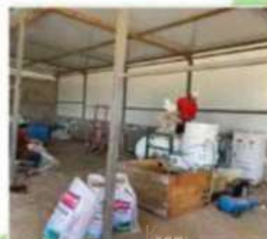
Тэсэлгээний бодисын шуудай дахин боловсруулах тоног төхөөрөмж