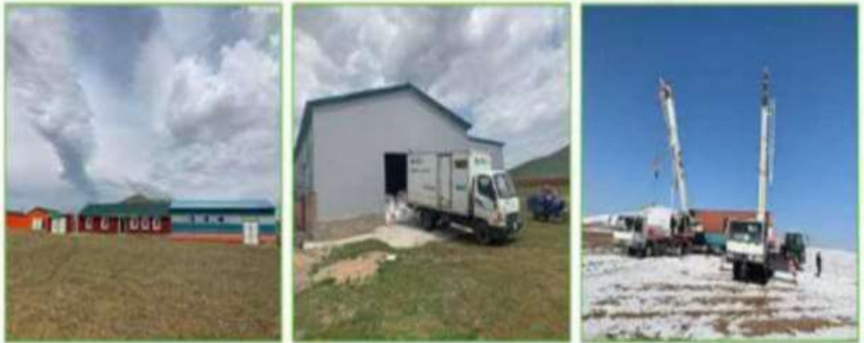
Зураг 1 Үйлдвэрийн барилга байгууламжийн зураг

Үйлдвэрийн хүчин чадлын хувьд 1 цагт 300 кг, өдөрт 1800 кг шуудай дахин боловсруулах ба хуванцар, химийн бодисын бохирдолтой сав, полиэтилен канистр, торх, ИВС танк зэрэг хуванцарыг 1 цагт 500 кг, өдөрт 4 тн-г боловсруулах хүчин чадалтай. Эдгээрийг хаягдал тус бүрээр тооцвол өдөрт 1500 ш канистр, 400ш торх, 258ш ИВС танк болно.