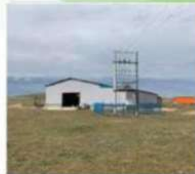
Агуулахын барилга байгууламж