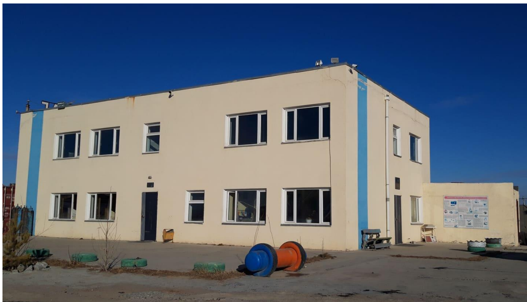
Зураг 1-2. Ажилчдын байр