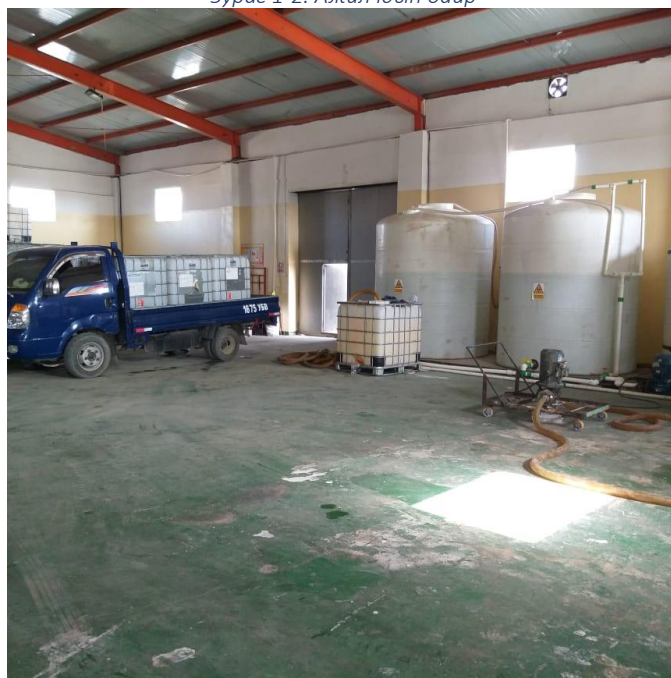
Зураг 1-3. Химийн бодисын агуулах