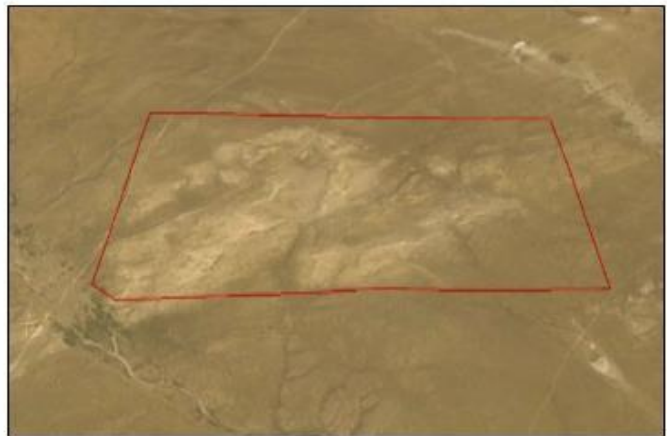
Зураг 1. Төсөл хэрэгжих талбайн байршилийн топо зураг