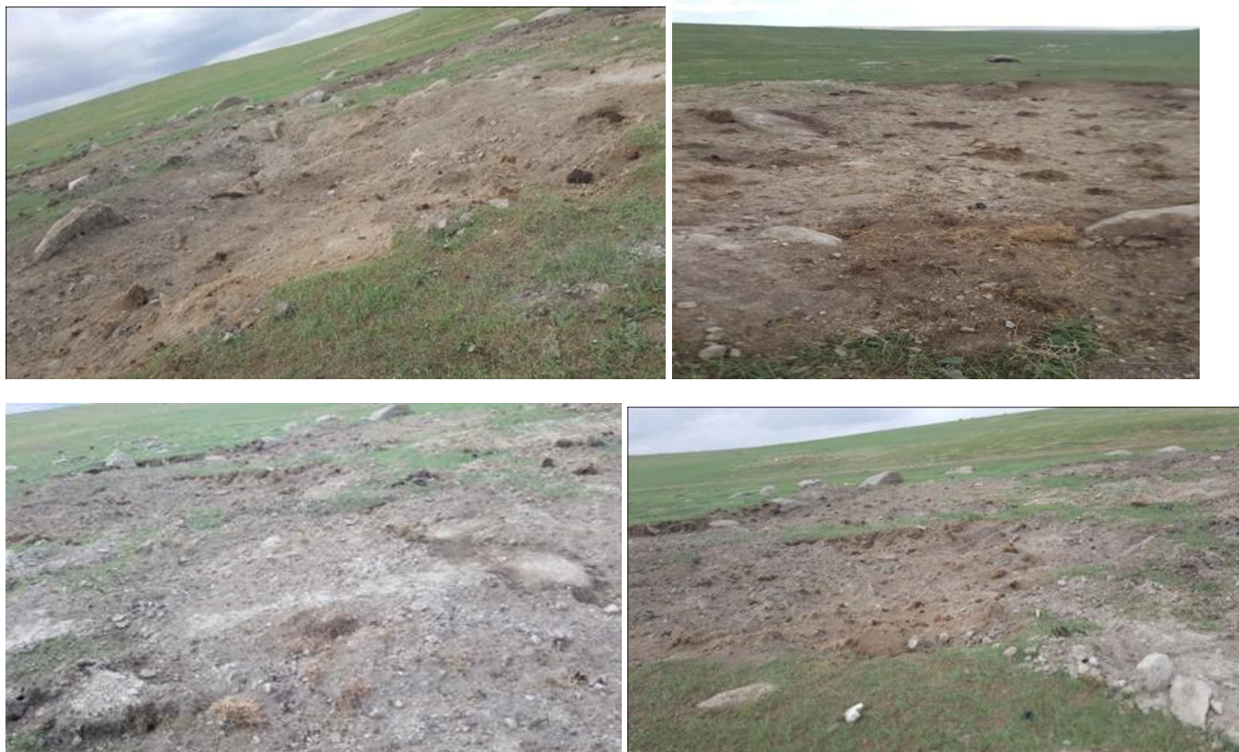
Зураг 7. Нөхөн сэргээлтийн зураг