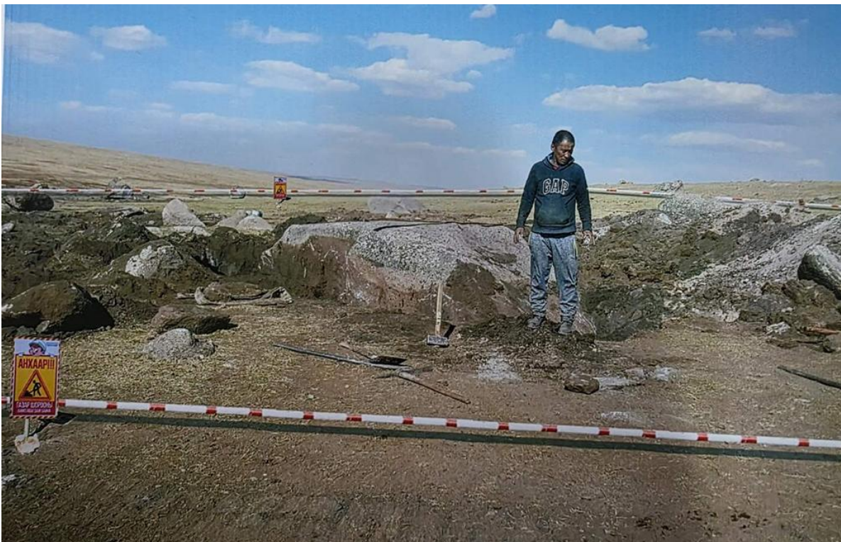
Зураг 11 . Олборлох үйл ажиллагаа