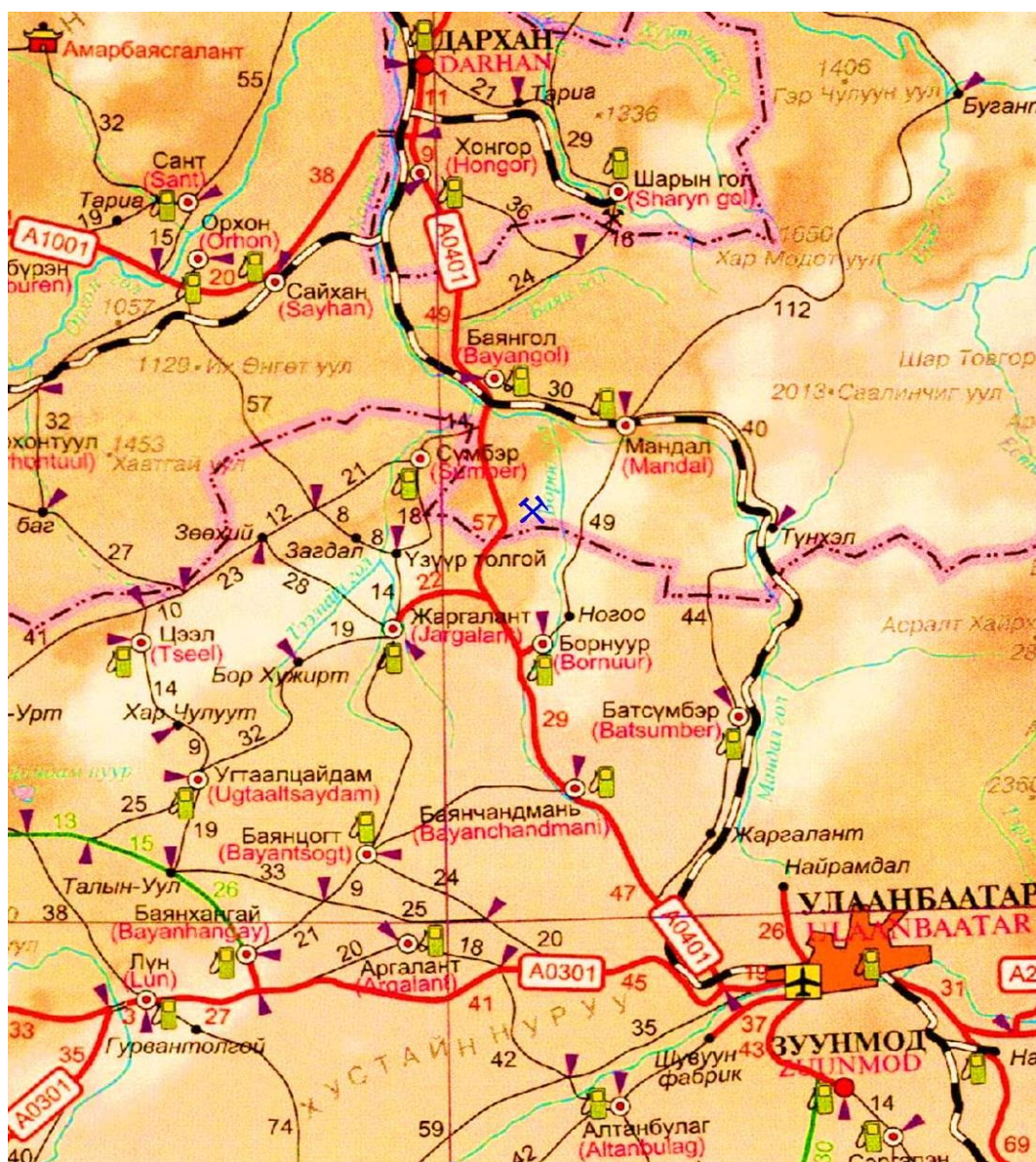
Зураг №1 Цагаанчулуутын уурхайн байршил