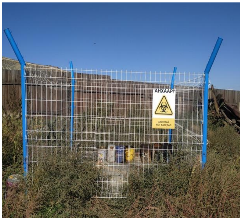
Зураг №5 Аюултай хог хаягдалын цэг.

3:3 харьцаатай бетонон шалтай сараалжаар хашсан аюултай хог хаягдлын цэг байгуулсан ба тос, масло, аккумулятор, тосны шүүр тэдгээрийн сав зэргийг бүртгэн авч аюултай хог хаягдлын цэгт төвлөрүүлж дахин боловсруулдаг ААН-д өгнө.