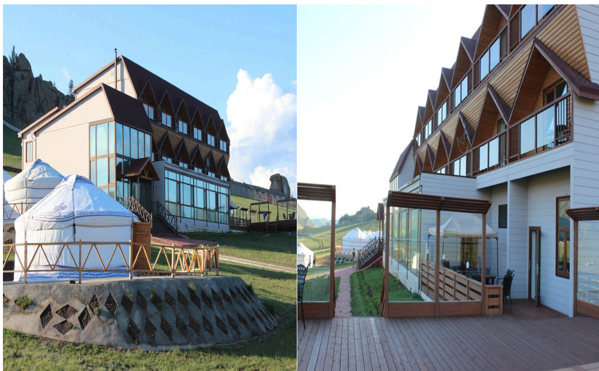
Зураг 2. Үйлчилгээний төв барилга