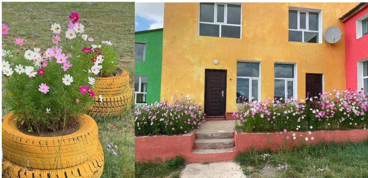
Зураг 4. Цэцгийн мандал байгуулсан байдал

“Хос хэрэм” жуулчны баазын талбайд аялал жуулчлалын зориулалтаар байшин, гэр, хүүхдийн тоглоом, автомашины зогсоол, сагс, волейболын талбайг цементлэж, явган хүний зам тавьсан байгаа нь ургамлан нөмрөг нэмж талхагдалд өртөхөөргүй төслийн үйл ажиллагаанаас ургамлан нөмрөгт үзүүлэх сөрөг нөлөөлөл нь харьцангуй бага байна.