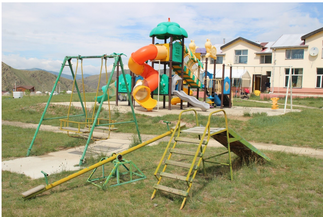
Зураг 2. Сагсны болон тоглоомын талбай