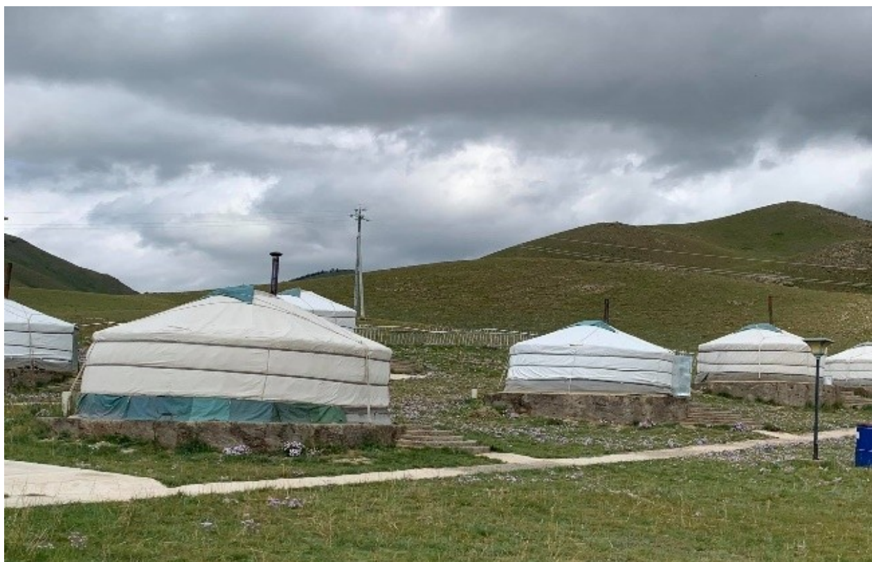
Зураг 3. Явган хүний зам

Төслийн талбайн тээврийн хэрэгслийн зогсоолын хайрган хучилт багассан тул амрагчдын автомашин хүний хөдөлгөөнөөр газрын гадарга нөлөөлөлд өртөх магадлалтай