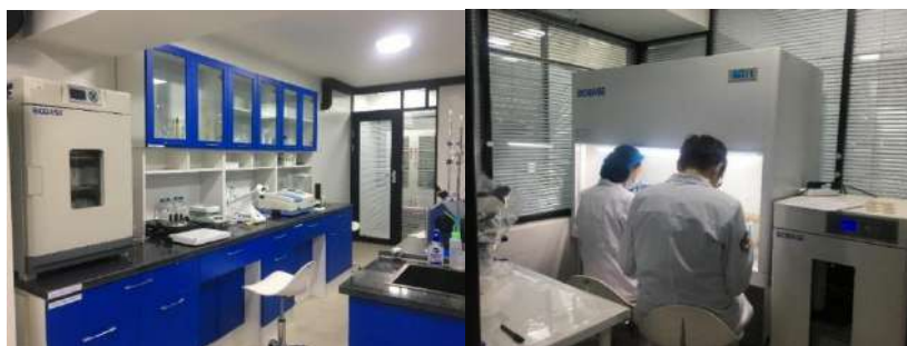
Зураг 3. Дотоод хяналтын лаборатори

Урвалж, бодисыг лабораторитой залгаа тусдаа өрөөнд, зориулалтын тусгай шүүгээнд хадгалдаг.