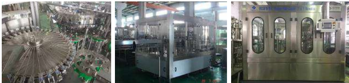
Зураг 2. Үйлдвэрийн дотоод орчин, тоног төхөөрөмж

Тоног төхөөрөмж: Тус үйлдвэр бүтээгдэхүүний савлагаа бэлдэх, үлээх төхөөрөмж, 0.33л, 0.5л, 1.0 л хэмжээтэй бүтээгдэхүүн савлах шугам, найрлага бэлдэх үндсэн тоног төхөөрөмжүүдийг ашиглаж байна.