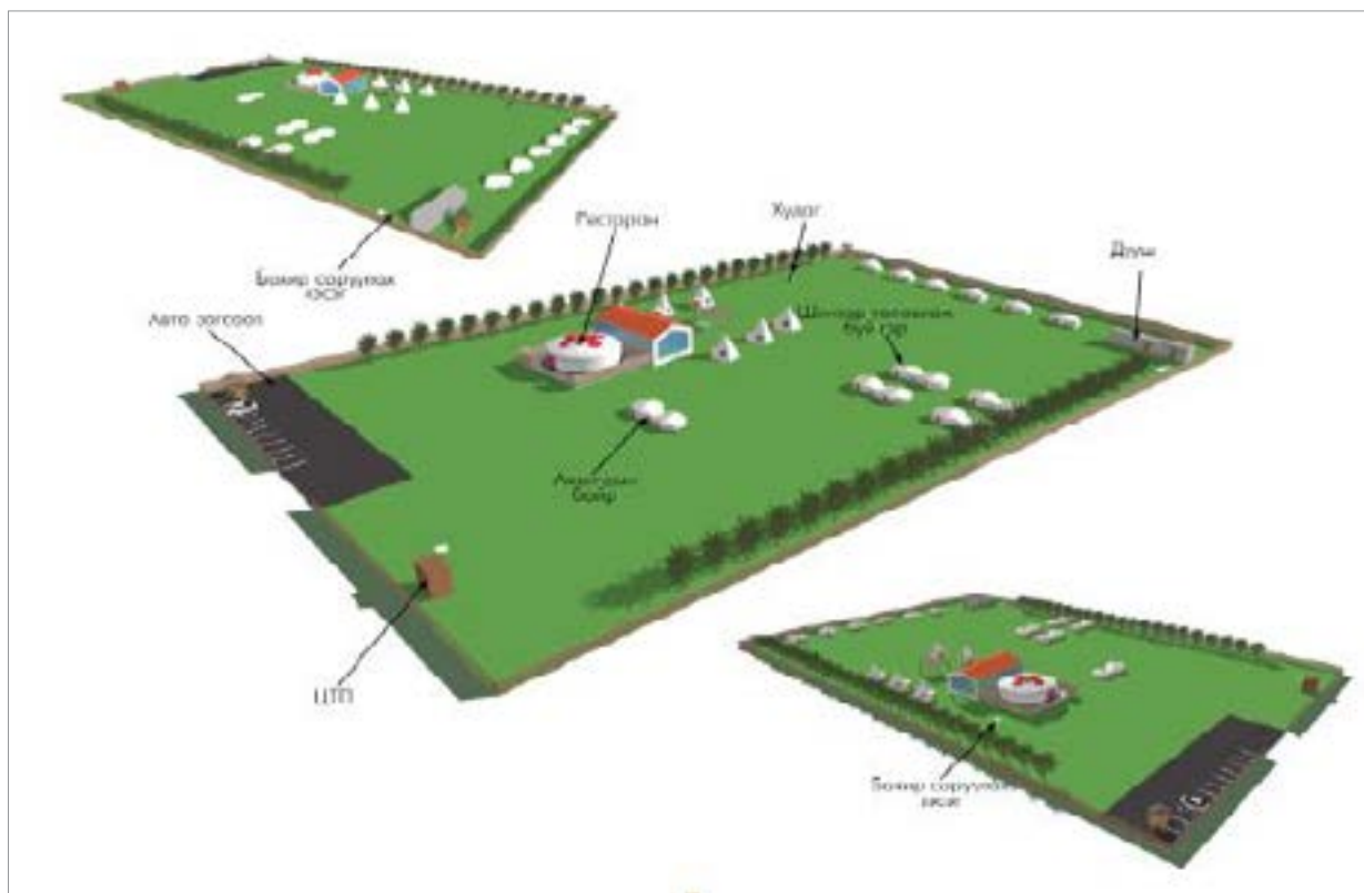
Зураг 1.2. Жуулчны баазын ерөнхий төлөвлөгөө

Төслийн хүчин чадал: Тус жуулчны бааз нь жилд 3 сар ажиллах бөгөөд бүрэн хүчин чадлаараа ажиллахад нэг дор 100-150 хүн хүлээн авах хүчин чадалтай.