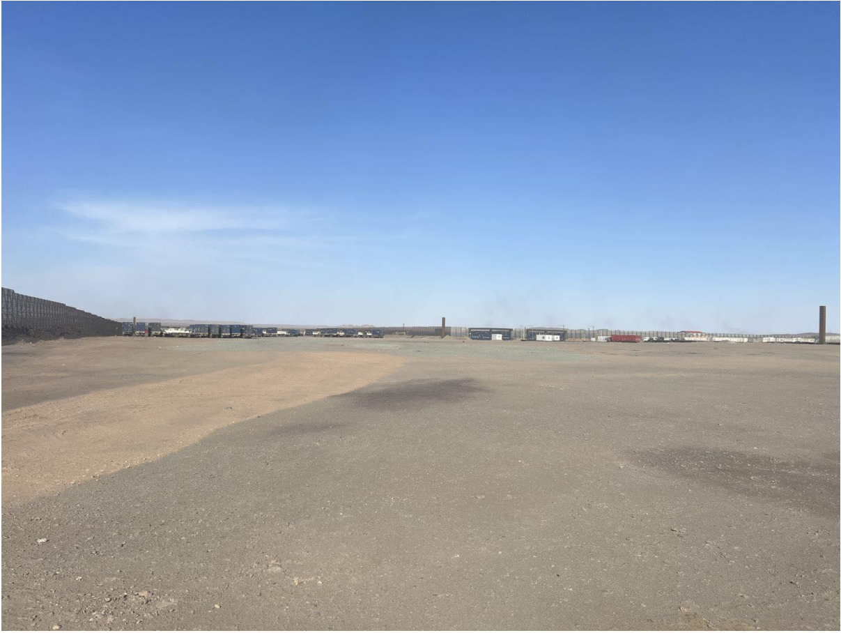
Зураг 1-4. Төслийн талбайн фото зураг

Төсөл хэрэгжих нийт 10 га талбайн 3 га талбайд ажилчдын кемп, 3 га талбайд авто зогсоол байгуулж үлдсэн 4 га талбайд нүүрс ачиж буулгах талбай байгуулах юм. Үүнээс 3 га талбай нь орц, гарцын хэсэг байна.