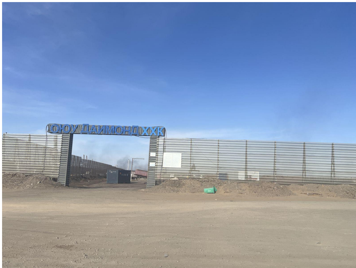
Зураг 1-3. Төслийн талбайн фото зураг

Төслийн талбайн өнөөгийн фото зургийг Error! Reference source not found. , Error! Reference source not found. -т тусгав.