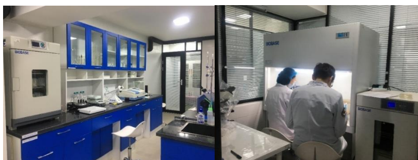
Зураг 3. Дотоод хяналтын лаборатори

Дотоод хяналтын лабораторит нийт 67 нэр төрлийн химийн бодис, урвалжийг дотоодын ханган нийлүүлэгч тусгай зөвшөөрөлтэй “Грийн химистри” ХХК-иас худалдан авч, ашиглаж байна. Хэмжээний хувьд жилд 35.5 л шингэн бодис, 25.7 кг хуурай, хатуу төлөв байдалтай урвалж, бодис ашиглаж байна.