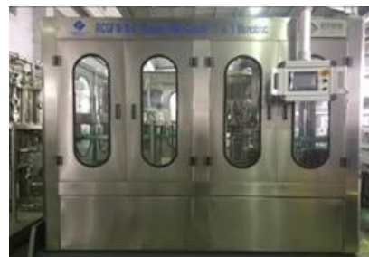
Зураг 2. Үйлдвэрийн дотоод орчин, тоног төхөөрөмж

Бүтээгдэхүүн үйлдвэрлэх үндсэн болон туслах түүхий эд: Үйлдвэрлэлд нийт 28 нэрийн үндсэн болон туслах түүхий эд, 4 нэрийн ургамал, 2 нэрийн жимс, 58 нэрийн хайрцаг, сав баглаа боодол хэрэглэдэг. Түүхий эд, сав баглаа боодлыг дотоод болон гадаадын /Солонгос, Хятад, ОХУ/ гэрээт бэлтгэн нийлүүлэгчээс авдаг. Ургамлын түүхий эдийг гэрээт бэлтгэн нийлүүлэгч болон