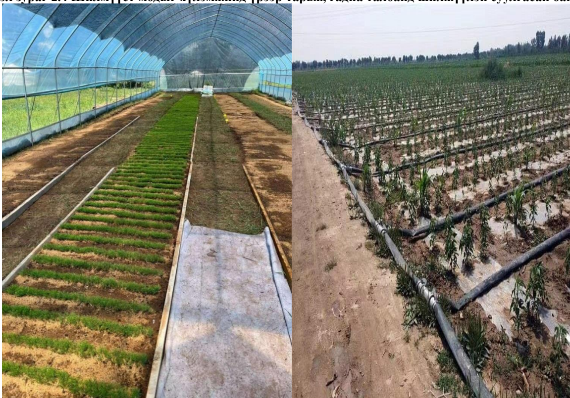
Гэрэл зураг 2.4 Шилмүүст модыг хүлэмжинд үрээр тарьж, гадна талбайд шилжүүлэн суулгасан байдал