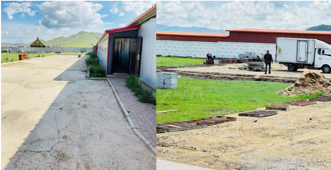
Гэрэл зураг 2.1 Тээврийн хэрэгсэл байнга зорчдог хэсгүүдийг хайрган болон хатуу хучилттай болгосон байдал