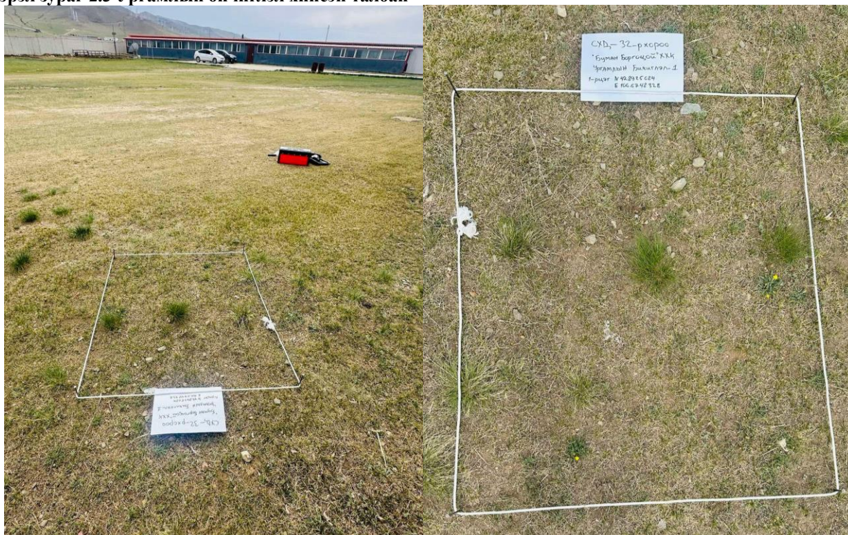
Гэрэл зураг 2.3 Ургамлын бичиглэл хийсэн талбай