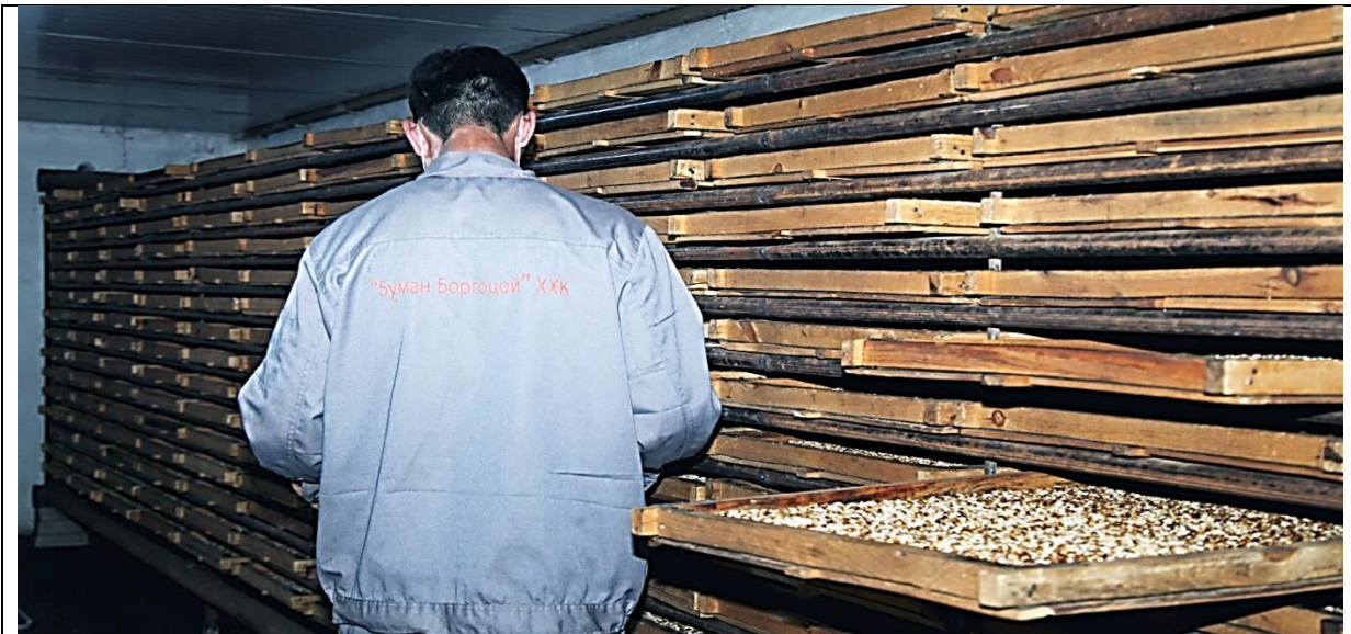
Хагас боловсруулсан самрын идээ