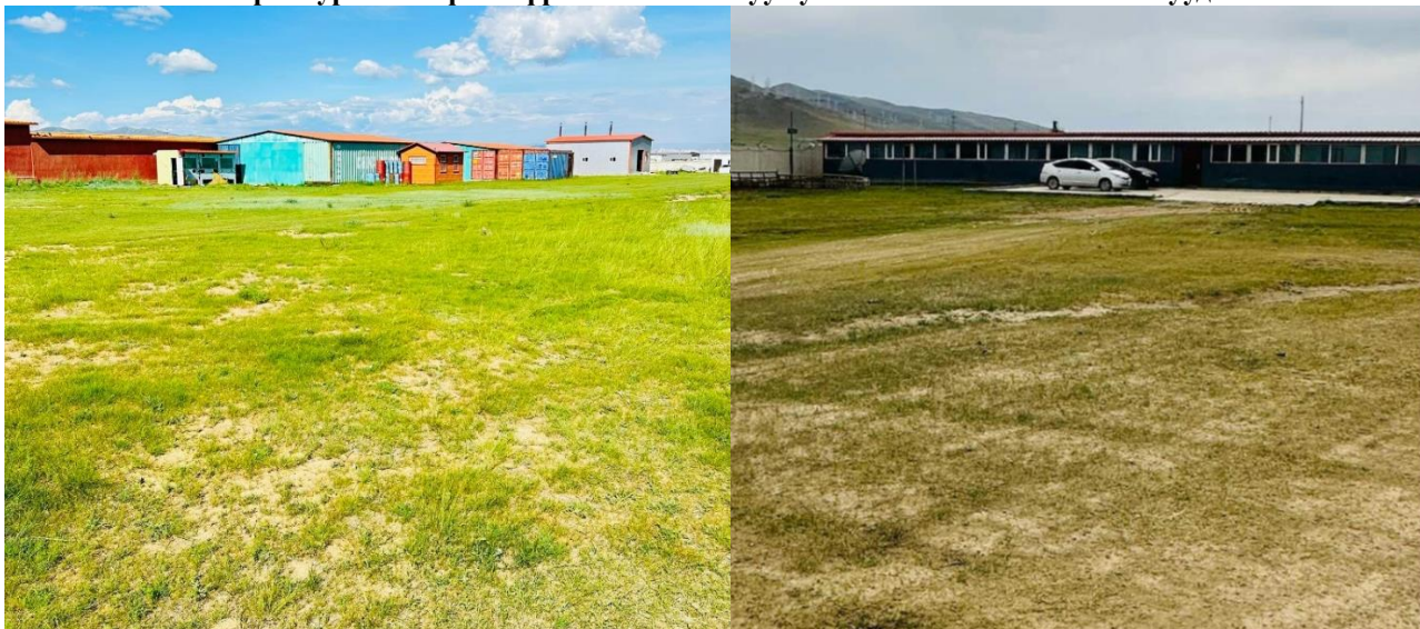
Гэрэл зураг 2.2 Зүлэгжүүлсэн болон хатуу хучилттай болгосон талбайнууд