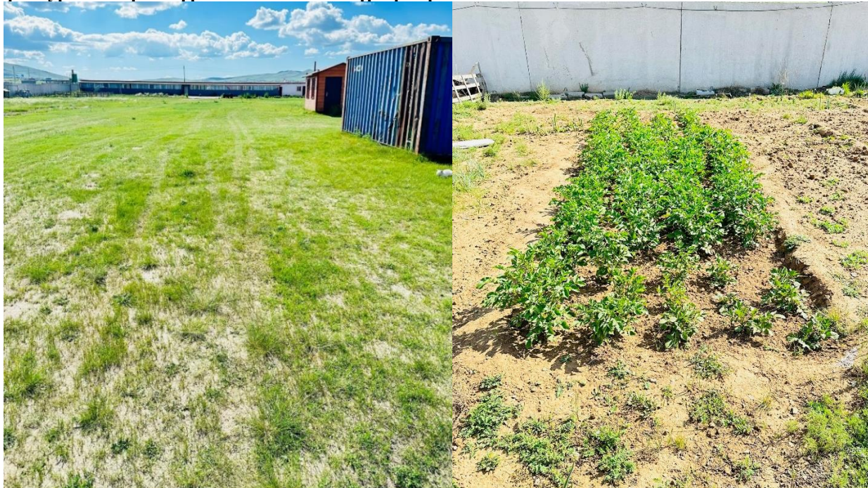
Гэрэл зураг 3.1 Зүлэгжүүлсэн талбай болон үрээр тарьсан хайлаас