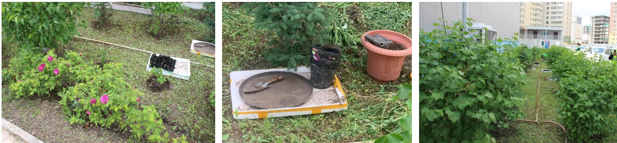
Зураг 6. Ногоон байгууламжийн арчилгаа, тордолтыг хийж буй байдал

Үндэсний цэцэрлэгт хүрээлэнтэй хамтран төсөл хэрэгжүүлж байгаа бөгөөд тус санамж бичгийн хүрээнд 2 га талбайд мод тарьж, тохижуулсан. Үйлдвэрийн эдэлбэр газрын 17% буюу 3202.6м 2 талбайд ногоон байгууламж байгуулсан.