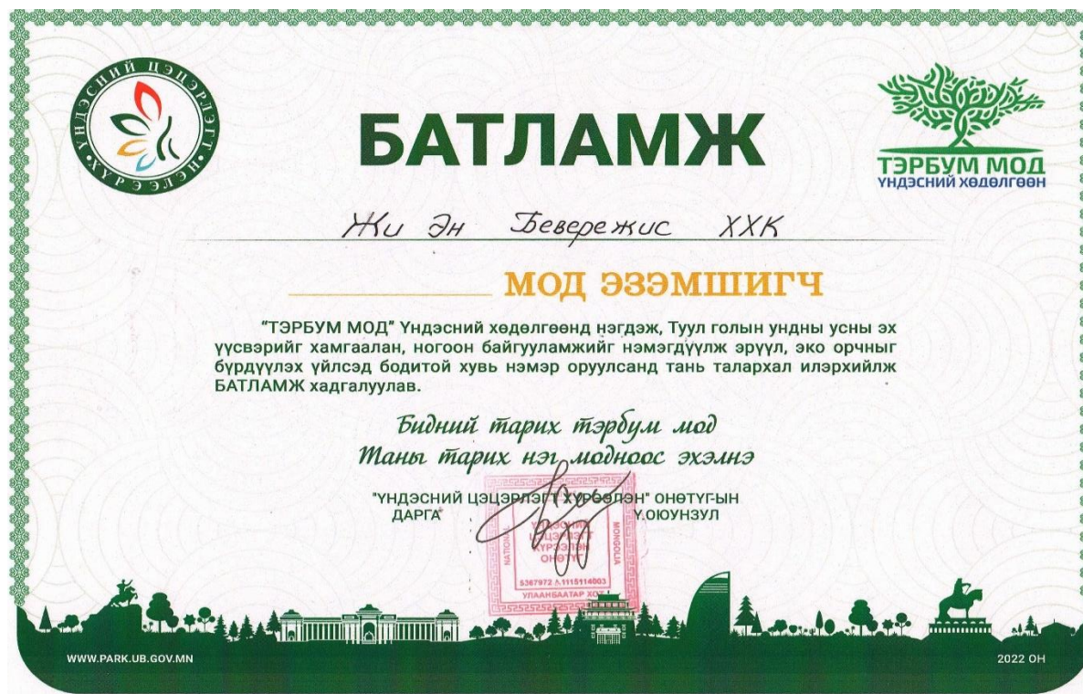
Зураг 5. Үндэсний цэцэрлэгт хүрээлэнд мод тарьж батламж авсан байдал

2023 онд “Жи эн бевережис” ХХК-ийн ажилтнууд Тэрбум мод үндэсний хөдөлгөөний хүрээнд Туул голын ундны усны эх үүсвэрийг хамгаалах, ногоон байгууламж нэмэгдүүлэх зорилгоор Үндэсний цэцэрлэгт хүрээлэнд мод тарьж батламж авсан байна.