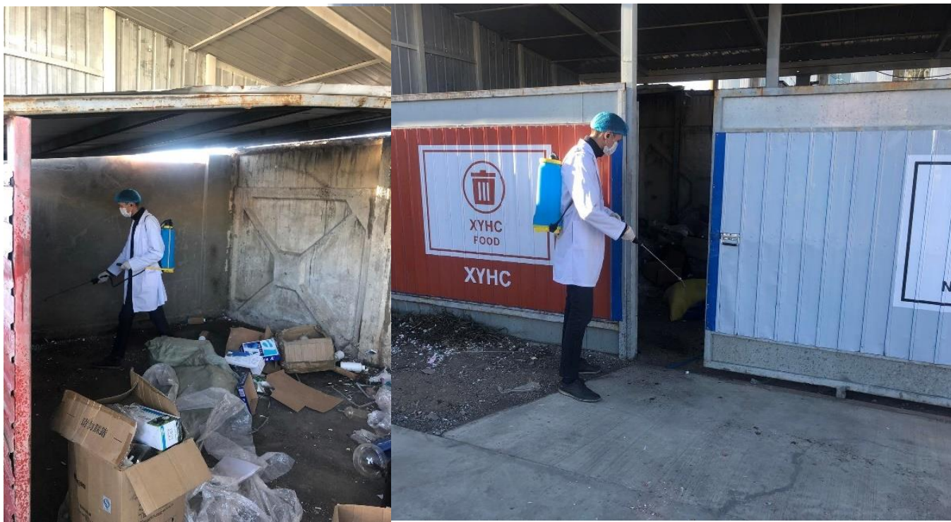
Зураг 10. Ундааны үйлдвэрийн хог хаягдлын цэгт ариутгал хийж буй байдал

“Жи Эн Бевережис” ХХК нь орчны бохирдлоос урьдчилан сэргийлэх зорилгоор ахуйн хаягдлын цэгт ариутгал, халдваргүйжүүлэлтийг сард 1 удаа хийж ажилласан.