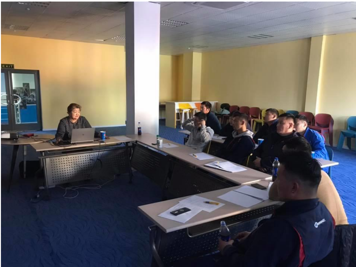
Зураг 8. ХАБ зааварчилгаа өгч буй байдал

Дээрх сургалтуудыг 1, 5, 10, 11 дүгээр саруудад “Цогзориг” ХХК, “Тэнгэр даатгал” ХХК, “Алтан чадамж” ХХК, “Цог зориг” ХХК, “Dryger” ХХК-тай хамтарч зохион байгуулсан бөгөөд давхардсан тоогоор 162 ажилчид хамрагдсан байна.