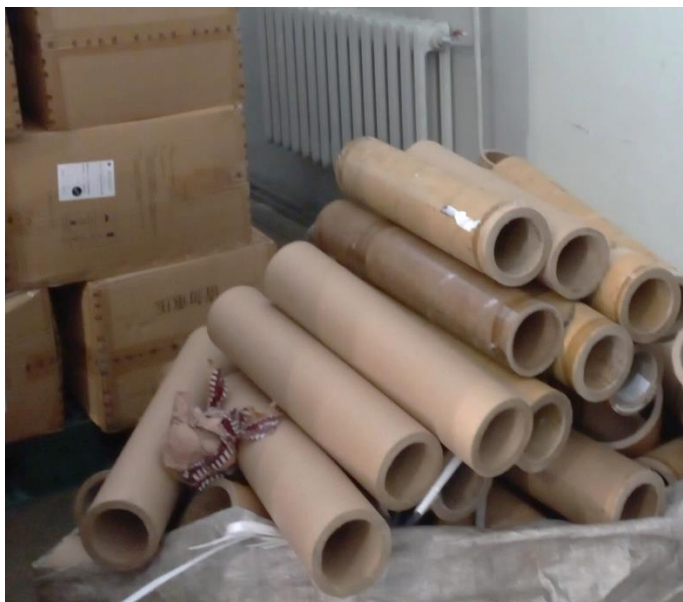
Зураг 12. Цаасан хайрцаг, рулоны гол