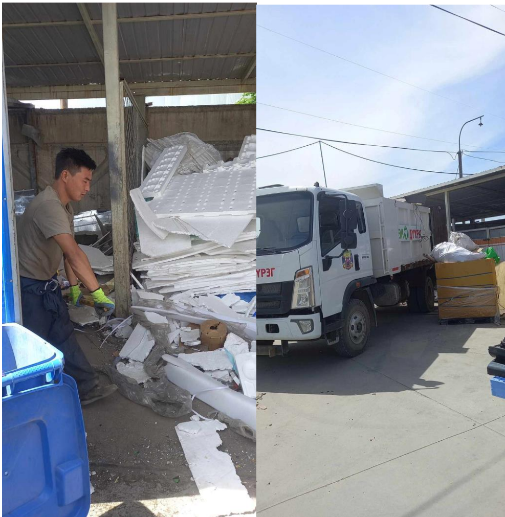
Зураг 11. Энгийн хог хаягдлыг гэрээний дагуу ачуулан зайлуулж буй байдал

“Пепси” ундааны үйлдвэрийн үйл ажиллагаанаас ундааны гологдол хуванцар сав, модон болон хуванцар подон, бүтээгдэхүүний цаасан хайрцаг зэрэг хаягдлууд гардаг. Дээрх хаягдлуудыг “Мультитак” ХХК-дад хамтран ажиллах гэрээний хүрээнд нийлүүлэн дахин боловсруулалт хийж ажилласан.