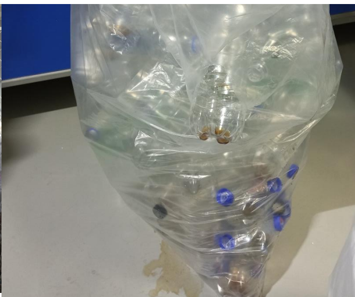
Зураг 13. Хаягдал хуванцар сав болон гялгар уут