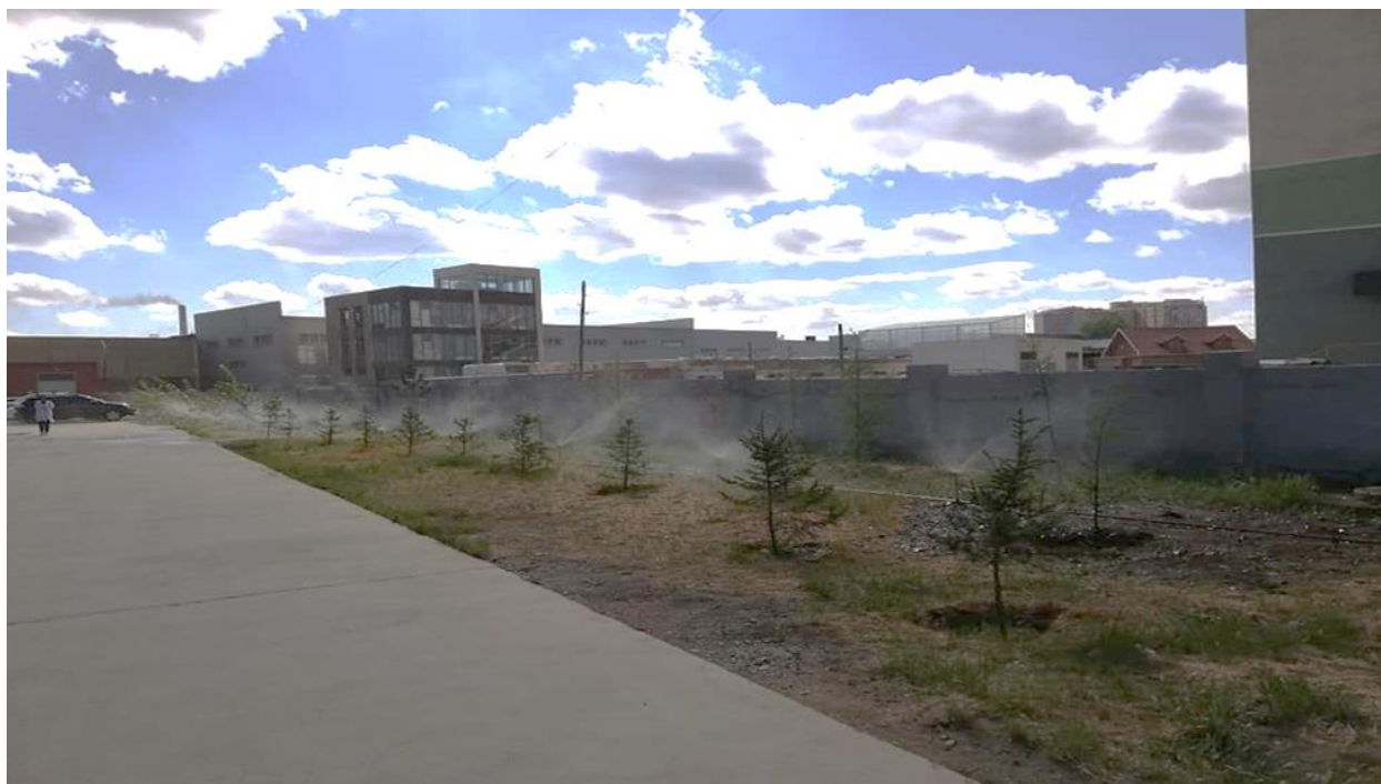
Зураг 1. Үйлдвэрийн хашаанд усалгаа хийж буй байдал

“Пепси” ундааны үйлдвэр нь 2022 онд суурилуулсан усалгааны Reverse osmosis (RO) ус боловсруулах системээс гарч буй хаягдал усыг үйлдвэрийн гадна орчны тоосжилтын хэмжээг бууруулах зорилгоор ашиглан тогтмол усалгаа хийж байна.