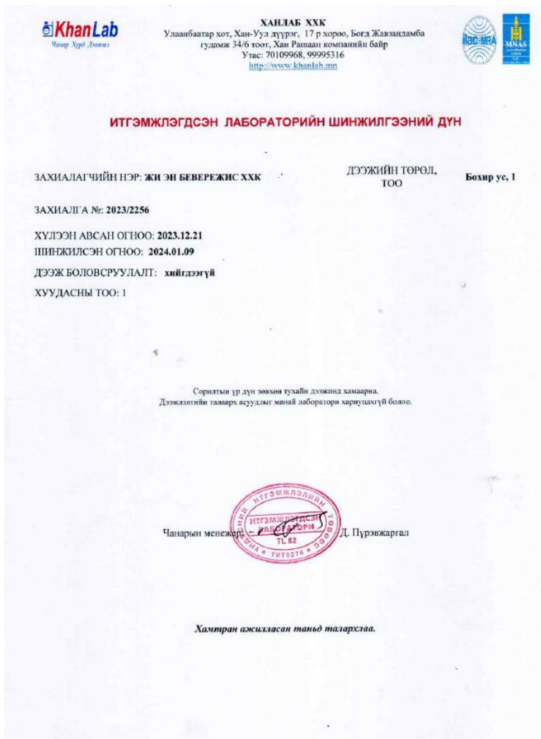
Зураг 2. Бохир усны шинжилгээ