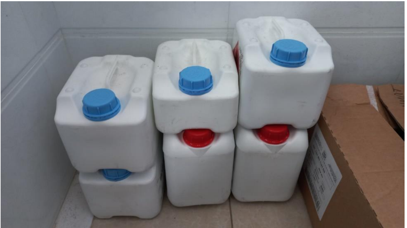
Зураг 4. Химийн бодисын агуулах