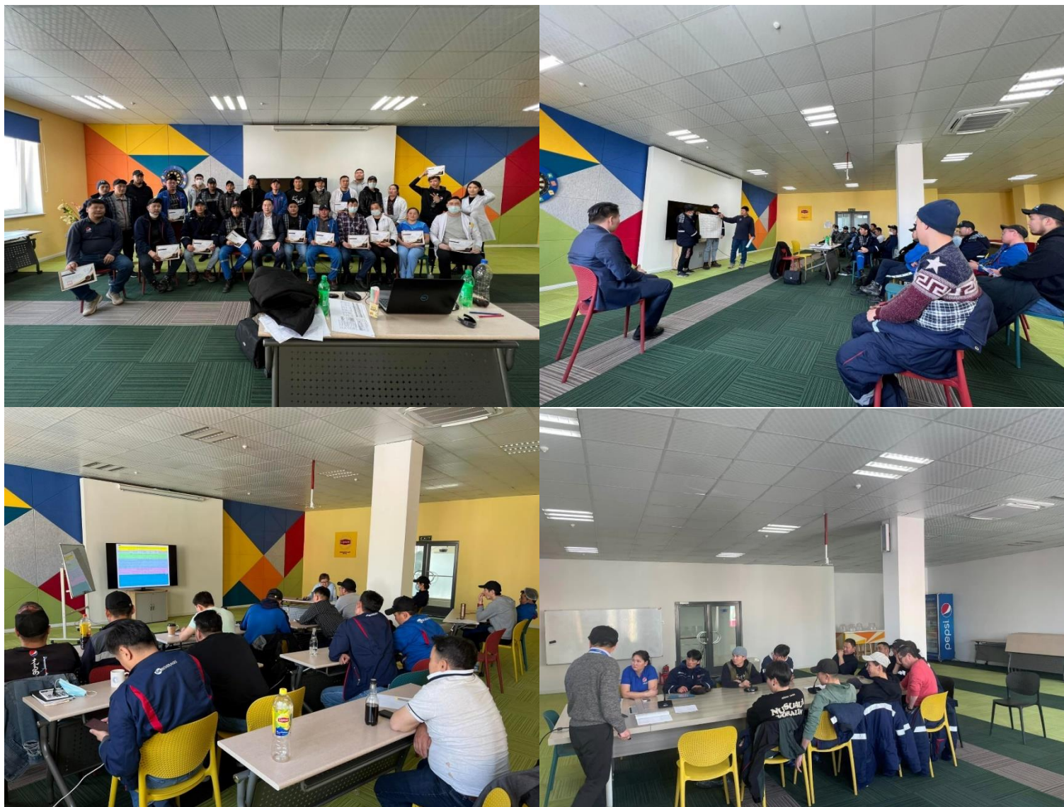
Зураг 9. Ажилчдад сургалт зохион байгуулж буй байдал