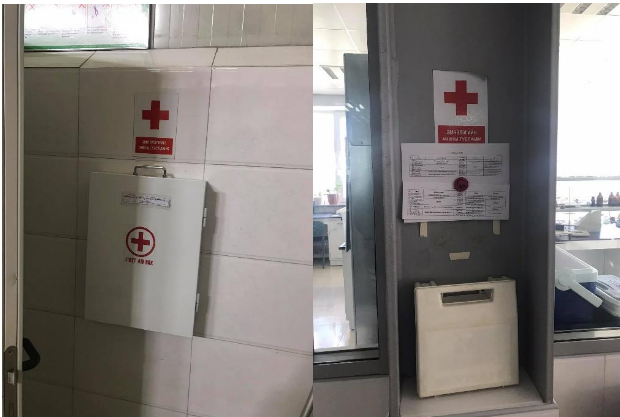
Зураг 7. Анхны тусламжийн багаж хэрэгсэл байршуулсан байдал

Ажилчдад анхан шатны тусламж үзүүлэх арга зааврыг таниулах заавар зөвлөмжийг тогтмол өгч ажилладаг ба анхны тусламжийн багаж хэрэгслийг үйлдвэр, агуулах, лаборатори гэсэн шаардлагатай байгаа 5-н хэсэгт шинээр байрлуулсан.