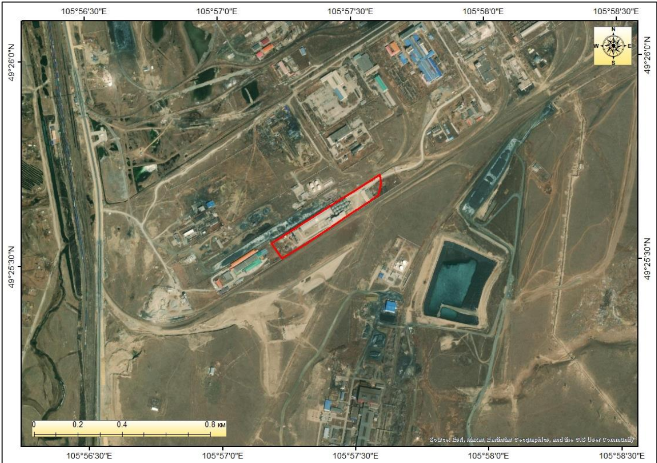
Зураг 1. Төслийн байршил

Төслийн талбай нь 2015 оны 06 дугаар сарын 17-ны өдрийн А/206 тоот захирамжтай, Дархан-Уул аймгийн Дархан сумын 13-р багийн нутаг, үйлдвэрийн бүсэд байрзүйн М-48-92 хавтгайд хараа голын сав газарт хамааран 45068м 2 талбайг хамран байрлаж байна.