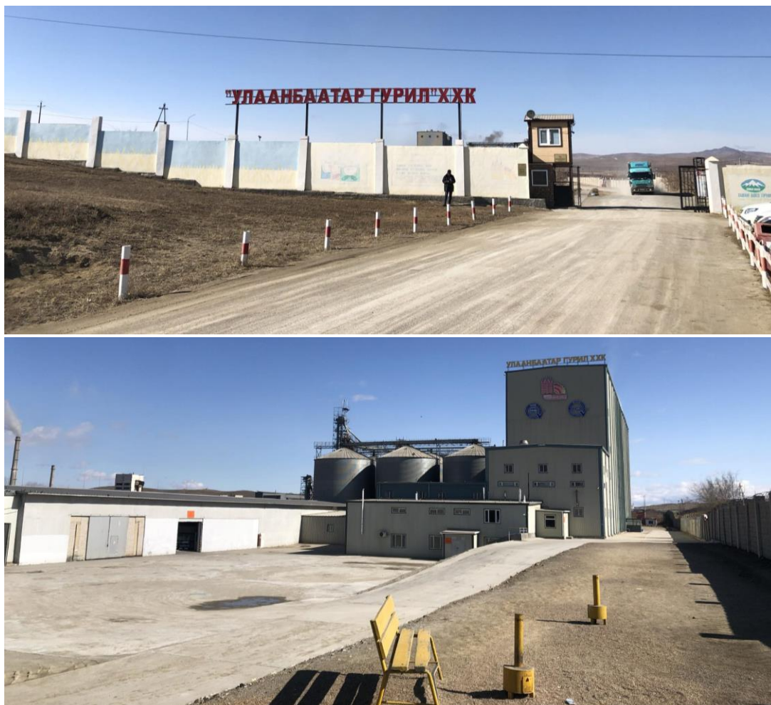
Зураг 2. Төслийн дэд бүтэц

Үндсэн барилга байгууламж нь гурилын үйлдвэр, улаан буудайн агуулах, бэлэн бүтээгдэхүүний агуулах гэсэн бүрэлдэхүүнүүдтэй. Үйлдвэрийн барилга 5 давхар, тоосгон хийцтэй.