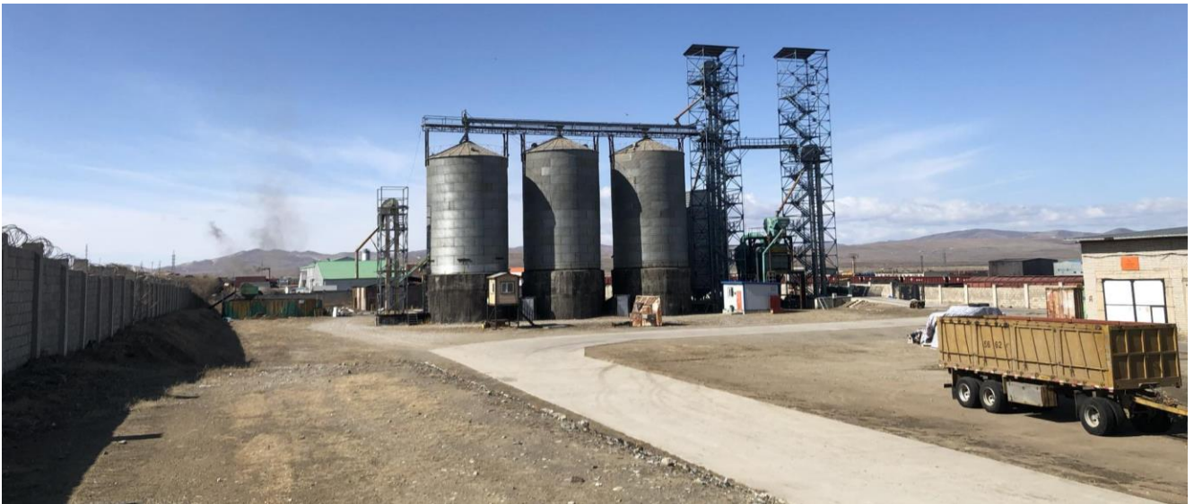
Зураг 3. Буудай хадгалах силос

2020 оны 12 дугаар сард Англи улсын “BUHLER” брэндийн буудайнаас өнгөөр ялгаатай тарианы ба хог хольцыг ялгах зориулалттай SORTEX A маркийн өнгөөр ялгагч машиныг суурилуулан ашиглалтад оруулсан. 2020 оны 7 дугаар сард бэлэн бүтээгдэхүүнийг хортон шавж мөн нүдэнд үл үзэгдэх өндөг авгалдайгаас урьдчилан сэргийлэх зорилгоор савлахын өмнөх технологийн процесст Турк улсын “ALAPALA” брэндийн хяналтын DVDU минутад 3000-ийн эргэлтийн хүчин чадалтай төхөөрөмжийг вакум шугамд суурилуулсан.