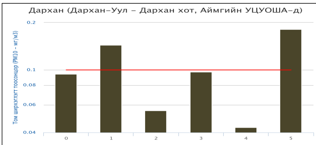
Зураг 6. Том ширхэглэгт тоосонцор

Шинэ Дарханд PM_{10} тоосонцорын агууламж 27\text{мкг}/\text{м}^3 -ээр ихэссэн үзүүлэлттэй байна.