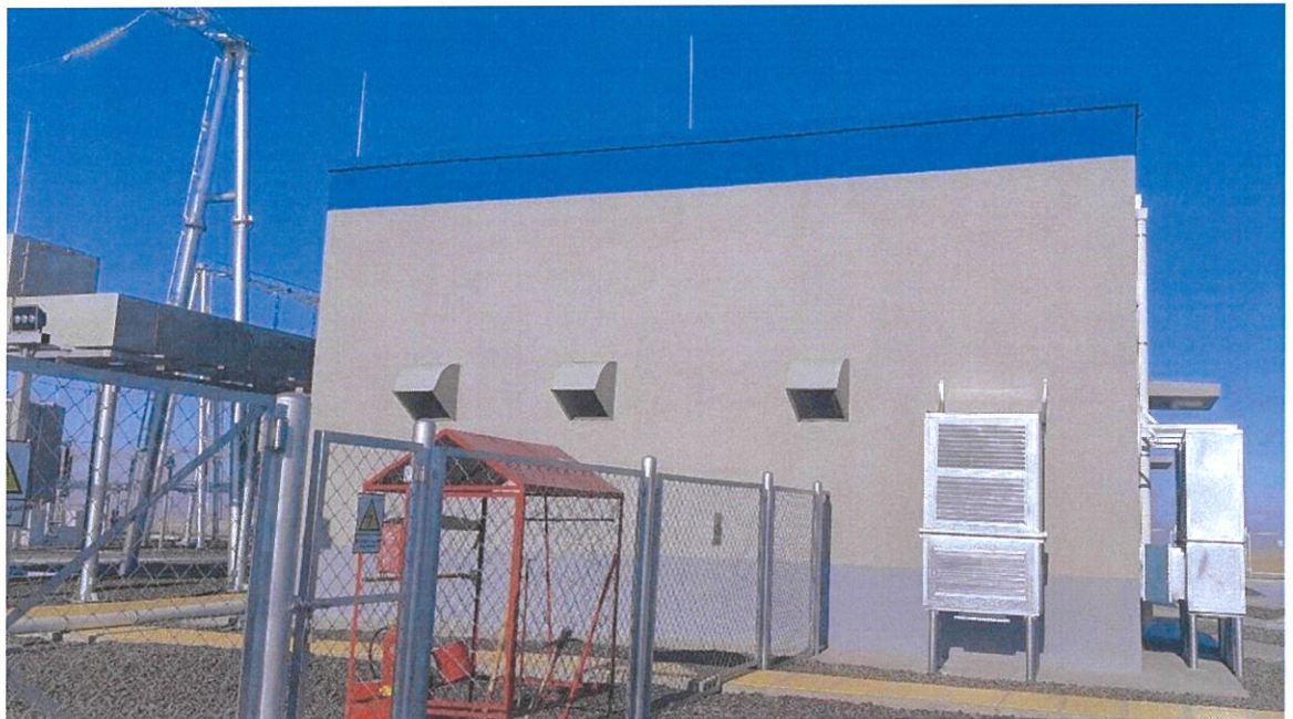
Зураг 1.6. Галын сарай