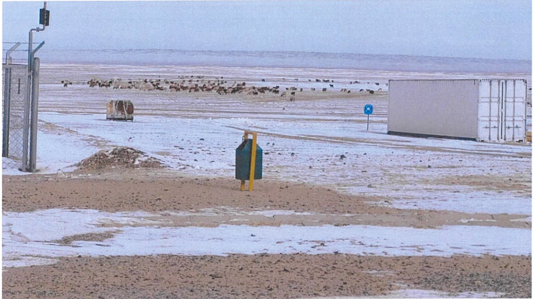
Зураг 1.7. Гамшиг ослын үед цугларах талбай, тэмдэг тэмдэглэгээ

Удирдлагын байр. Дэд станцаас 10 м зайд удирдлагын оффисын байрыг байгуулсан. Дэд станцын барилгын талбайн хэмжээ 342.3 м 2 , гадуураа хашаагаар хамгаалагдсан нэг давхар байшин байх ба тэнд оффис, хурлын танхим, ээлжийн ажилчдын удирдлагын хяналтын өрөө, 00-ын өрөө болон гал тогоо байрлана. Мөн ажилчдын усанд орох өрөө, дотор агуулах, жижиг засварын өрөө, граш зэргийг нэмэлт байдлаар зохион байгуулсан. Хашааны дотор болон гадна талд автомашины зогсоолыг бетонон хучилттай хийж шийдвэрлэсэн байгаа.