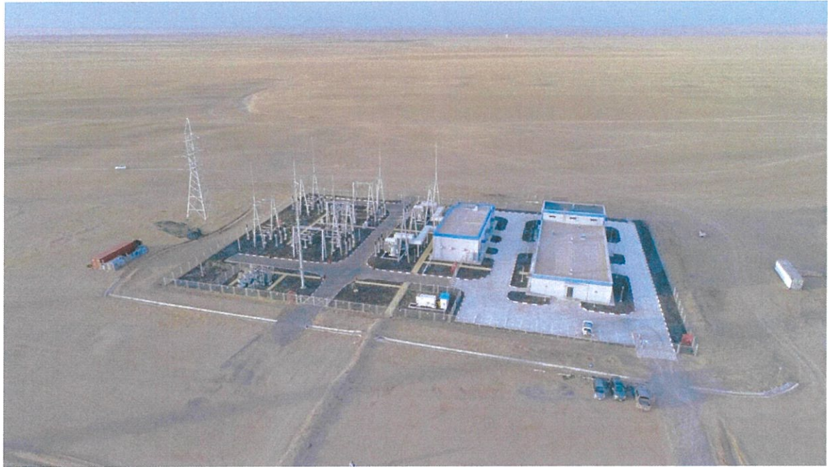
Зураг 1.2. Төслийн талбай