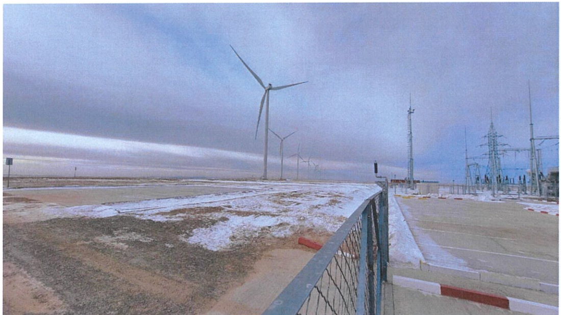
Зураг 1.8. Удирдлагын байрны гадна болон дотор зогсоол