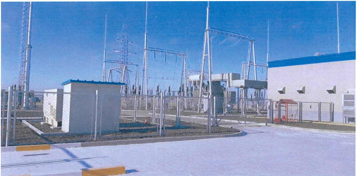
Зураг 1.4 35/110 кВ хуваарилах байгууламж

Дэд станц. Дэд станцын эзлэх талбай нь 6695.0 м 2 бөгөөд энд багаж төхөөрөмж, цахилгаан хэрэгслүүд болон шаардлагатай гадна байгууламжууд байгуулсан. Гадна байгууламжид үндсэн трансформатор, 110 кВ-ийн хуваарилах тоног, төхөөрөмж, 110 кВ-ийн тусгаарлагч, ГТ, ХТ болон аянга зайлуулагч, гэрэлтүүлэгч шугамууд, газардуулагч, ослын нөхцөлд ажиллах зориулалттай дизель генератор зэрэг багтаж байгаа. Цахилгааны барилга нь 35кВ-ийн хуваарилах төхөөрөмжийн өрөө, релений тоног төхөөрөмжийн өрөө, SVG төхөөрөмжийн өрөө болон батарей байгууламжийн өрөөнөөс бүрдэнэ. Осол аваарын болон засварын үед нэмэлт цахилгааны эх үүсвэр хэрэгтэй тул ослын нөхцөлд ажиллах зориулалттай дизель генераторыг дэд станцын хашаанд суурилуулсан.