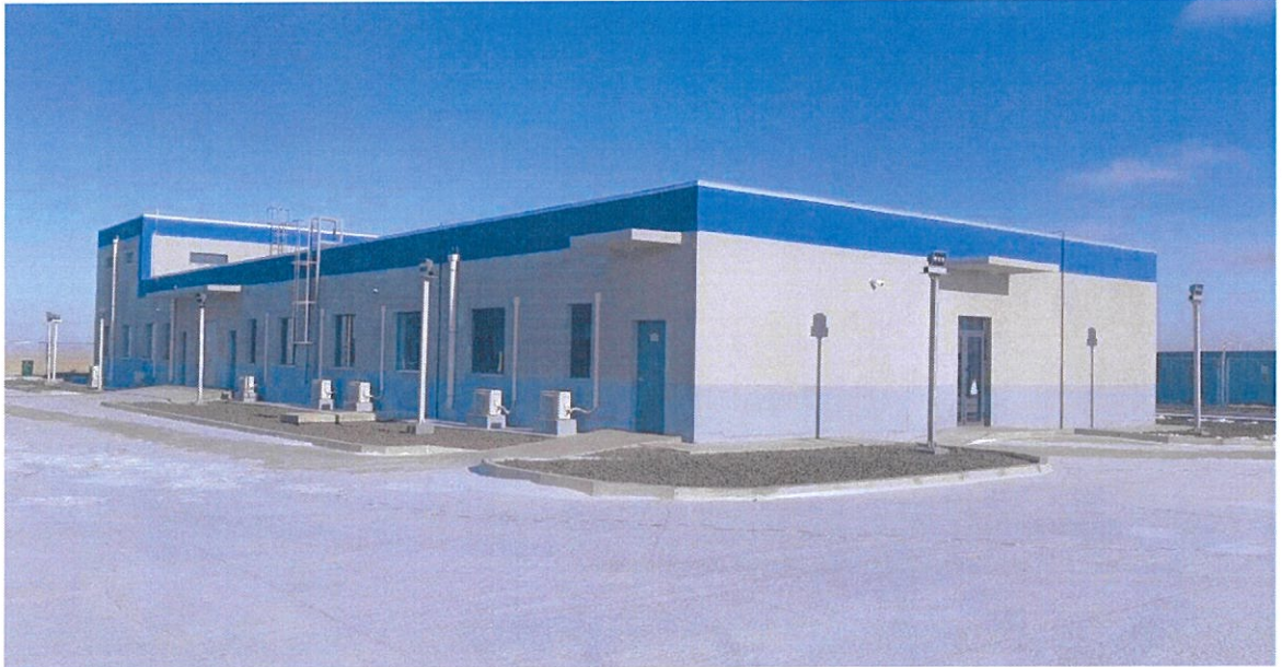
Зураг 1.5. Удирдлагын байр