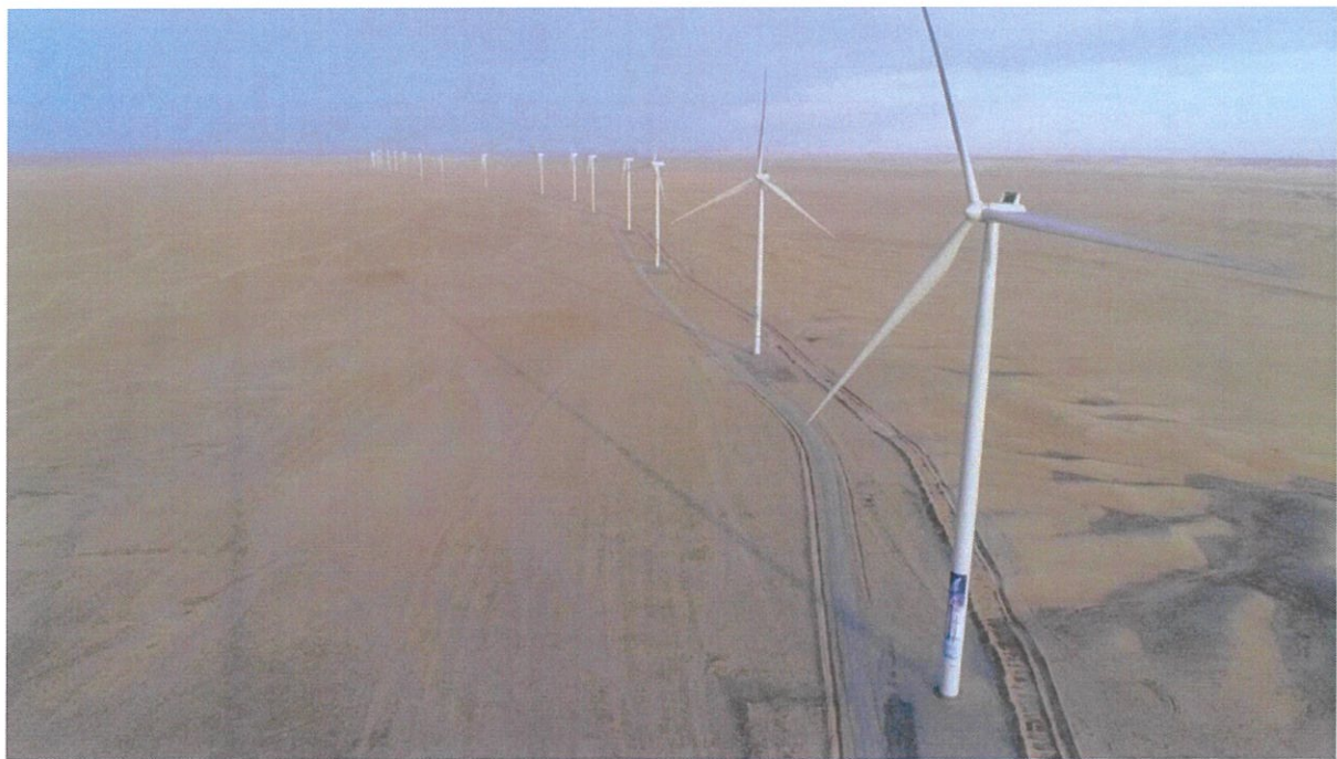
Зураг 1.3. Салхин турбин генератор