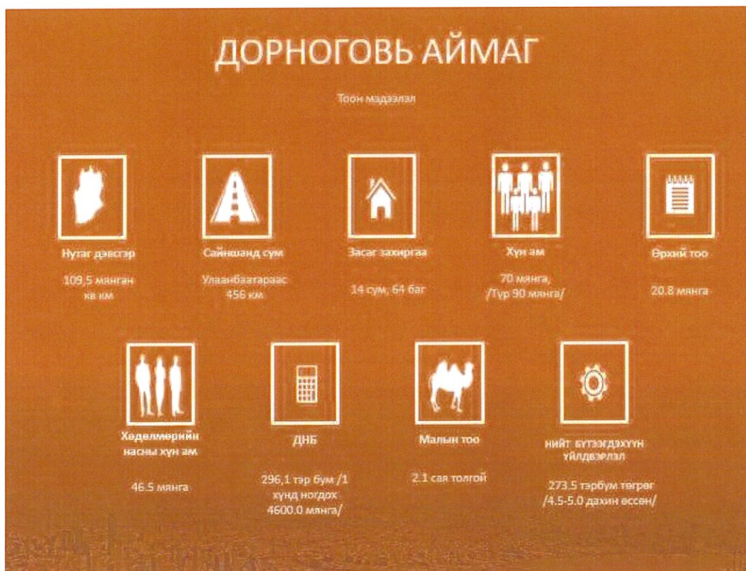
Зураг 2.1. Төсөл хэрэгжиж буй аймгийн нийгэм эдийн засгийн тоон мэдээлэл