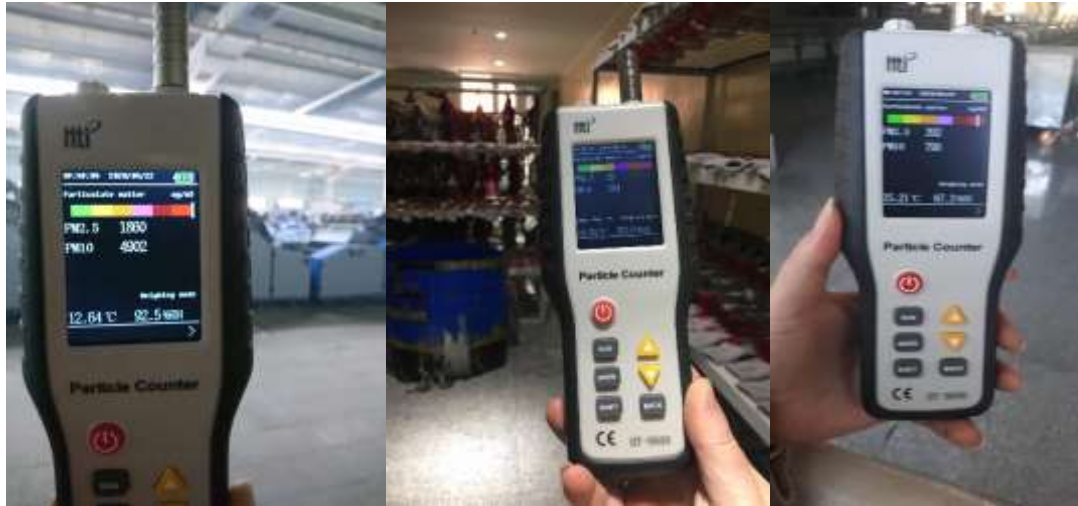
Зураг 9. “Янмал” ХХК-ийн самнах, оймсны, ээрэх үйлдвэрийн дотор явуулсан агаар чанарын хяналт шинжилгээ