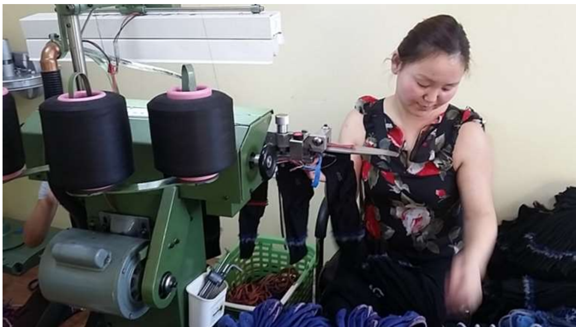
Зураг 4. Оймс битүүлж оёх машин

Оймс угаах болон хатаах төхөөрөмж нь БНХАУ-д үйлдвэрлэгдсэн бөгөөд хоногт 25 мянган хос оймс угааж хатаах хүчин чадалтай. Ноосон оймс, өвдгөвч, түрийг угааж боловсруулна.