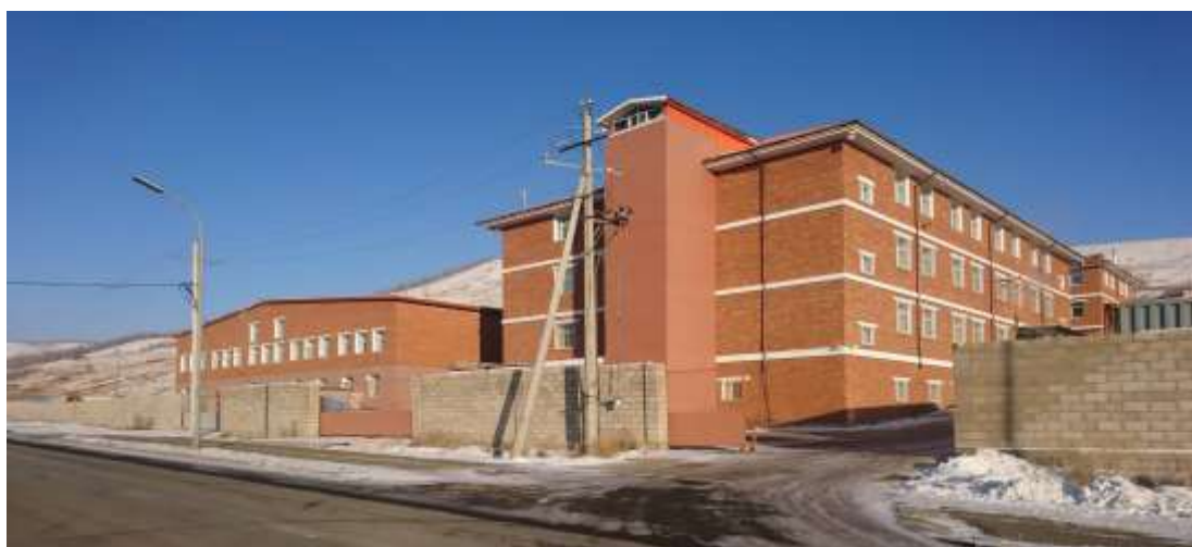
Зураг 1. Оймсны үйлдвэрийн байр