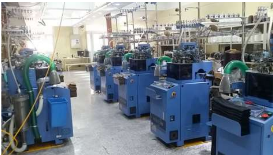
Зураг 3. Сүлжих машин

Сүлжих машин нь БНСУ-д үйлдвэрлэгдсэн бөгөөд компьютер удирдлагатай бүрэн автомат машин юм. 24 цагийн тасралтгүй ажиллагаагаар 10 жил ажиллах ба өдөрт 1 машин нь дунджаар 200 хос оймс үйлдвэрлэх хүчин чадалтай ба бид энэхүү хүчин чадлаа бүрэн ашиглаж байна.