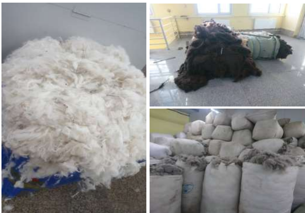
Зураг 2. Түүхий эд