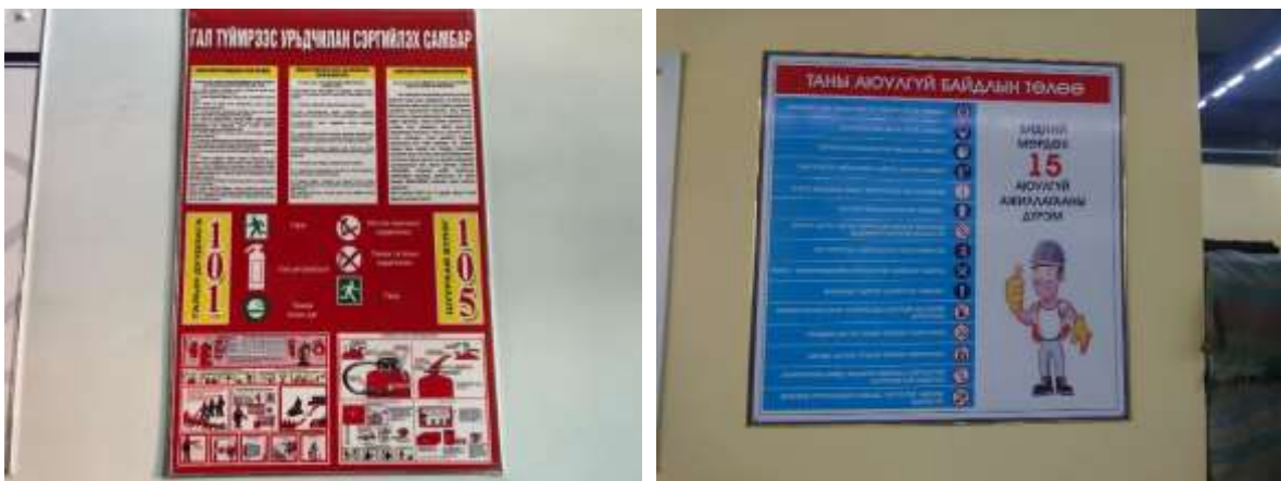
Зураг 7. Галаас урьдчилан сэргийлэх самбар болон аюулгүй ажиллагааны самбар

Цахилгаан эрчим хүч - Нийслэл хотын төвийн шугам сүлжээнд холбосон. Оймсны үйлдвэр нь цахилгаан эрчим хүчийг үйлдвэрийн гадна дотор гэрэлтүүлэг, агааржуулалт, холбооны ахуйн хэрэглээнд, цэвэр усыг зөвхөн ахуйн хэрэглээнд ашиглах юм.