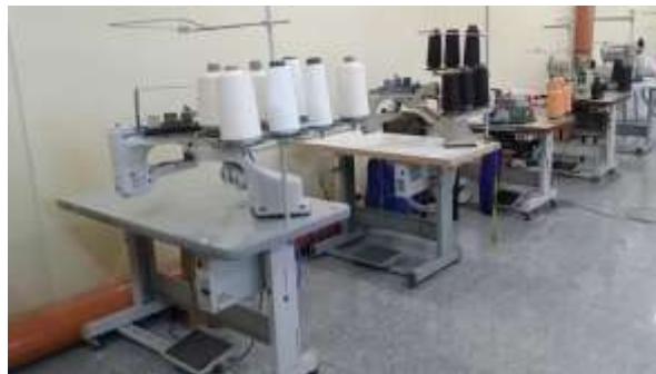
Зураг 6. Хүүхдийн трико үйлдвэрлэн оёх иж бүрэн шугам

Хүүхдийн трико үйлдвэрлэн оёх иж бүрэн шугам нь БНСУ-д үйлдвэрлэгдсэн бөгөөд битүүлж холбож оёх, захлан оёх, резин оёх, эсгүүр, индүүдэх гэсэн дамжлагуудтай иж бүрэн шугам юм. Хоногт 500 трико үйлдвэрлэх хүчин чадалтай. Эх бие болон бусад деталиудыг өөрийн оймсны машин дээр хийдэг ба эдгээр машинууд нь деталиудыг эсгэн хооронд нь холбож, резин хийж индүүдэн бэлэн болгох процесс явагддаг.