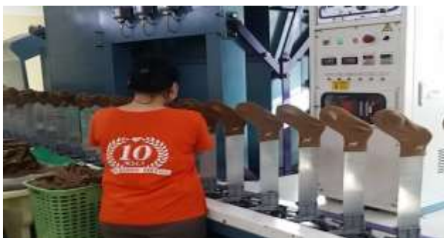
Зураг 5. Оймс индүүдэх уурын иж бүрэн машин

Оймс индүүдэх уурын иж бүрэн машин нь БНСУ-д үйлдвэрлэгдсэн бөгөөд өдөрт 20 мянган хос оймс индүүдэх хүчин чадалтай иж бүрэн уурын индүү юм. Уурын индүүгээр индүүдсэнээр оймсны бүтцэд ордог түүхий эдийн эдэлгээг уртасгаж, гоёмсог, чанартай зөв хэлбэртэй индүүдэх ач холбогдолтой. Монгол Улсад одоогоор ийм технологийн индүүний машин байхгүй байгаа.