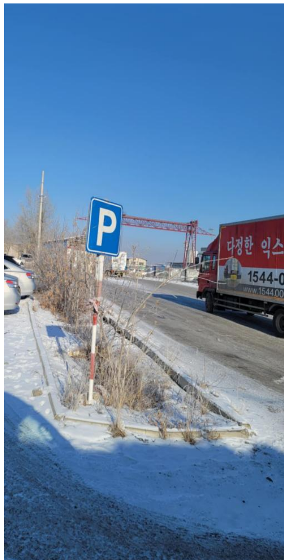
Б. Тарьсан байдал