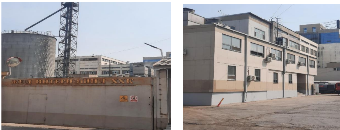
Зураг 3. Нүүрсхүчлийн хийн үйлдвэрийн гадаад байдал