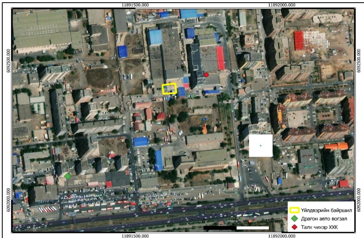
Зураг 1. “Нүүрсхүчлийн хийн үйлдвэр”-ийн байршлын зураг