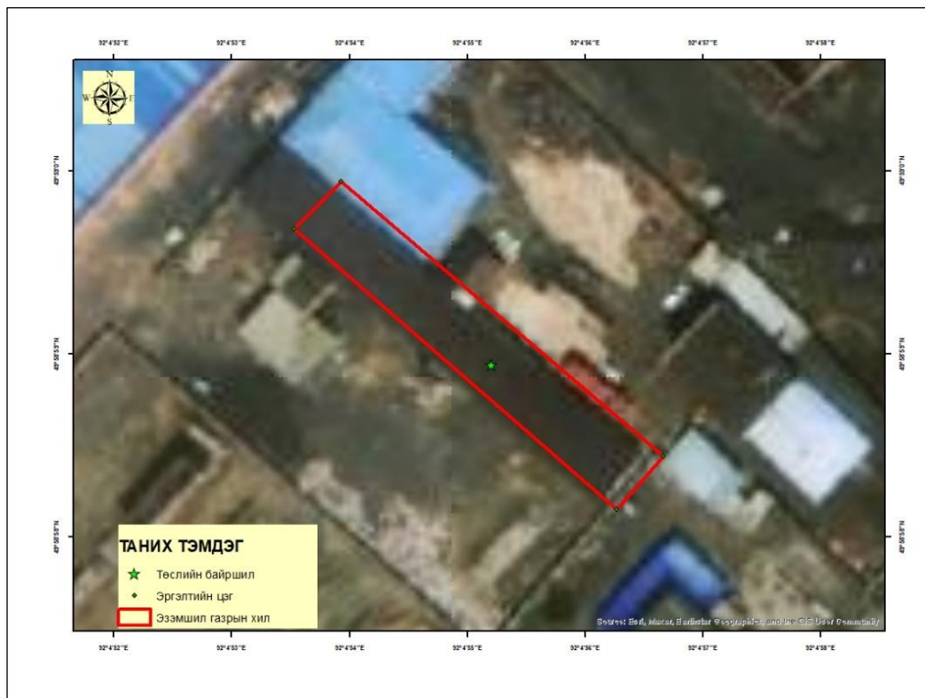
Зураг 1. “Арьс шир, ноос боловсруулах үйлдвэр”-ийн байршлын зураг