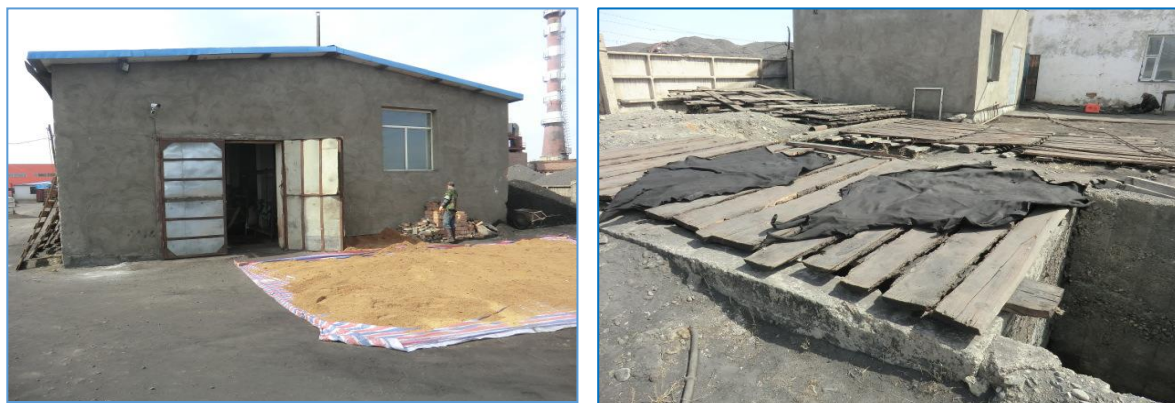
Зураг 3. Арьс шир, ноос боловсруулах үйлдвэрийн гадаад байдал