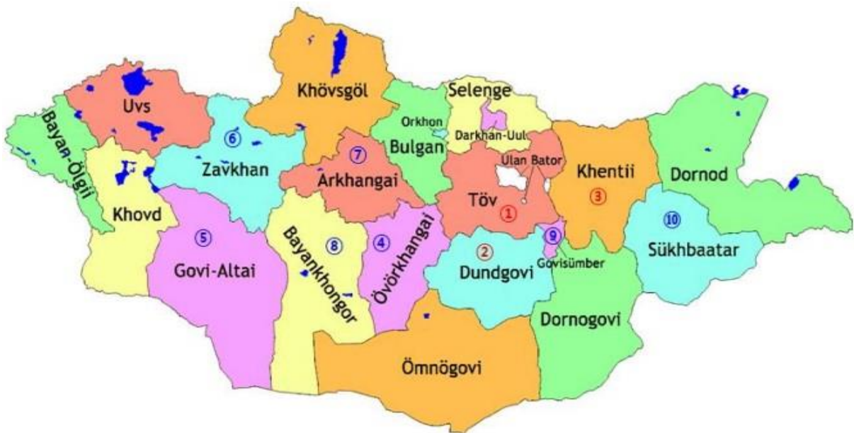
Зураг 2 Төслийн байршил

Төслийн хүрээнд хийгдэх бүх ажил 10 аймагт нэгэн зэрэг явагдана. Дулааны станцуудын геологийн судалгаа, талбайн төлөв байдлын судалгааг нарийвчилсан зургийн үед нэгэн зэрэг хийж гүйцэтгэнэ.