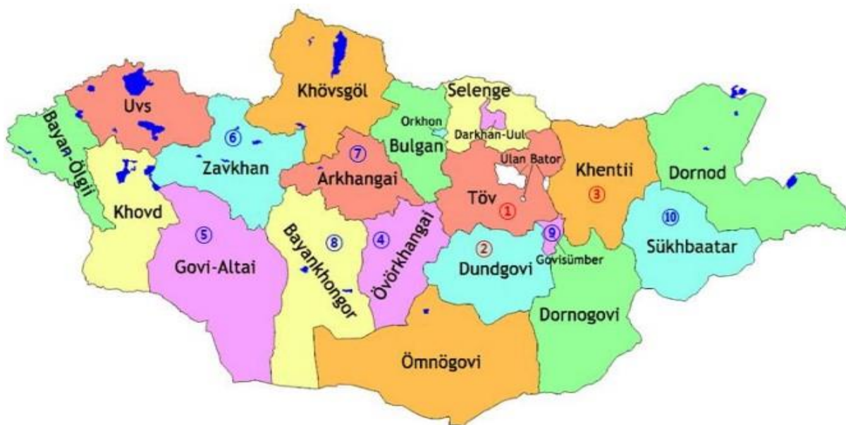
Зураг 2 Төслийн байршил

Төслийн хүрээнд хийгдэх бүх ажил 10 аймагт нэгэн зэрэг явагдана. Дулааны станцуудын геологийн судалгаа, талбайн төлөв байдлын судалгааг нарийвчилсан зургийн үед нэгэн зэрэг хийж гүйцэтгэнэ.