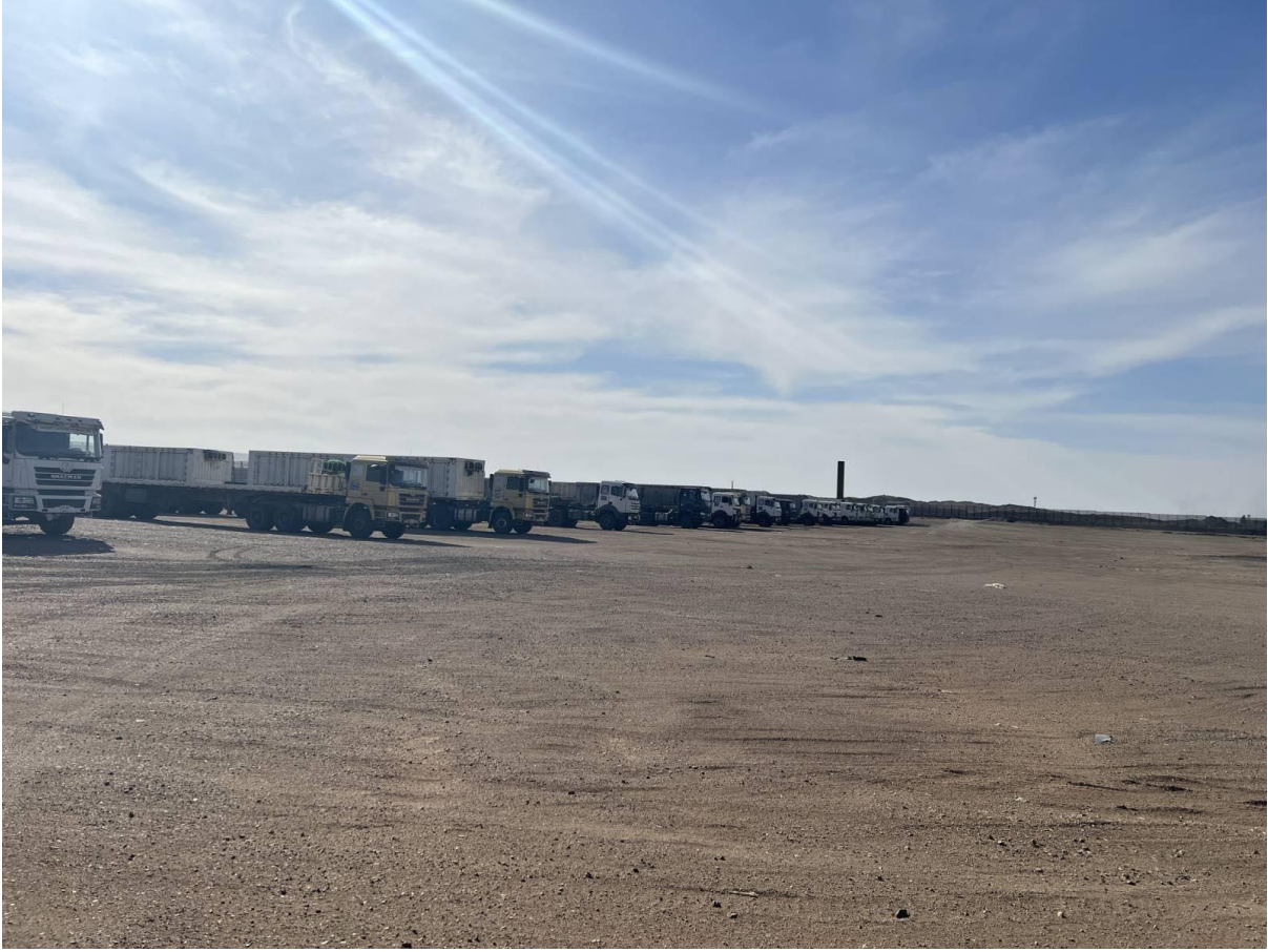
Зураг 1-4.Төслийн талбайн фото зураг

Төсөл хэрэгжих нийт 7 га талбайн 2 га талбайд ажилчдын кемп, 1 га талбайд авто зогсоол байгуулж үлдсэн 4 га талбайд нүүрс ачиж буулгах талбай байгуулах юм. Үүнээс 0.6 га талбай нь орц, гарцын хэсэг байна.