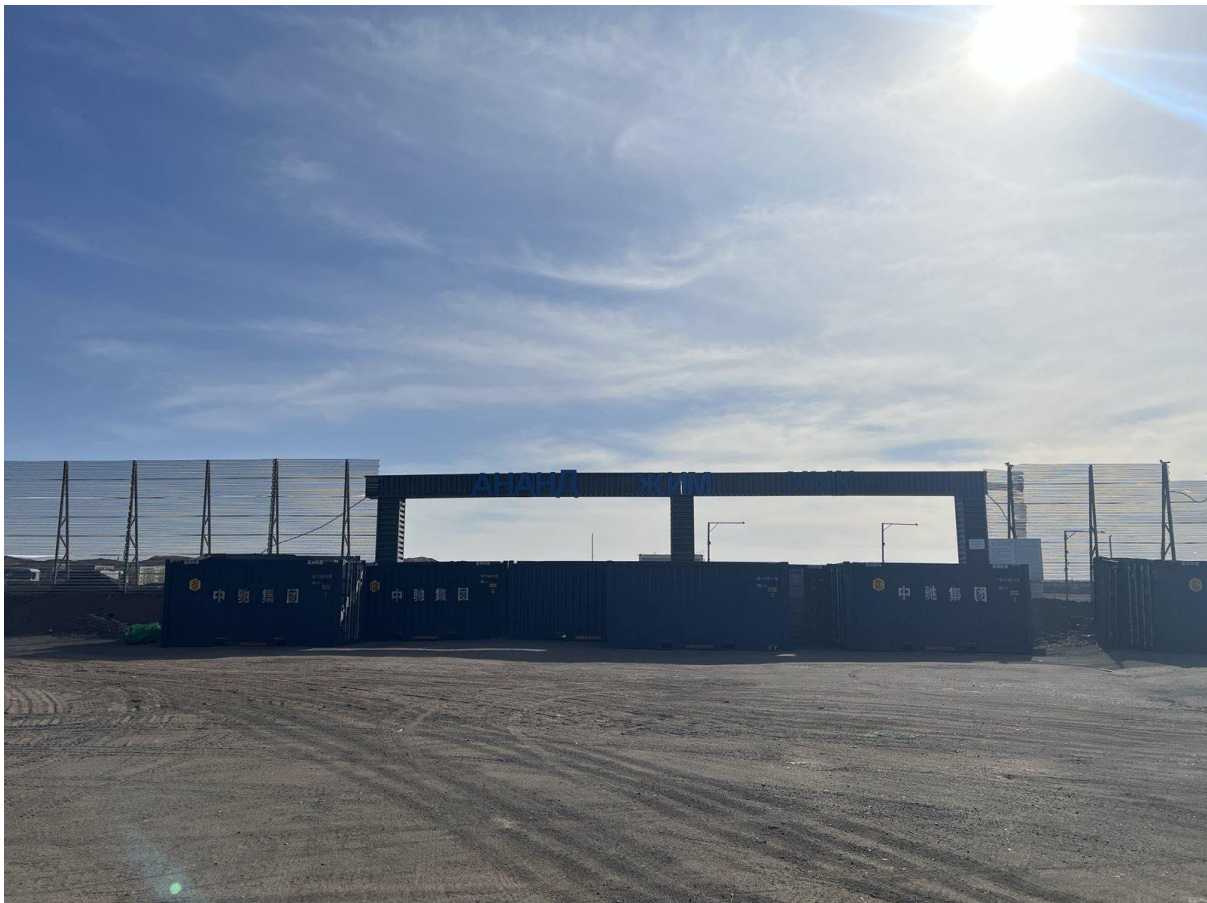
Зураг 1-3. Төслийн талбайн фото зураг

Төслийн талбайн өнөөгийн фото зургийг Error! Reference source not found. , Error! Reference source not found. -т тусгав.