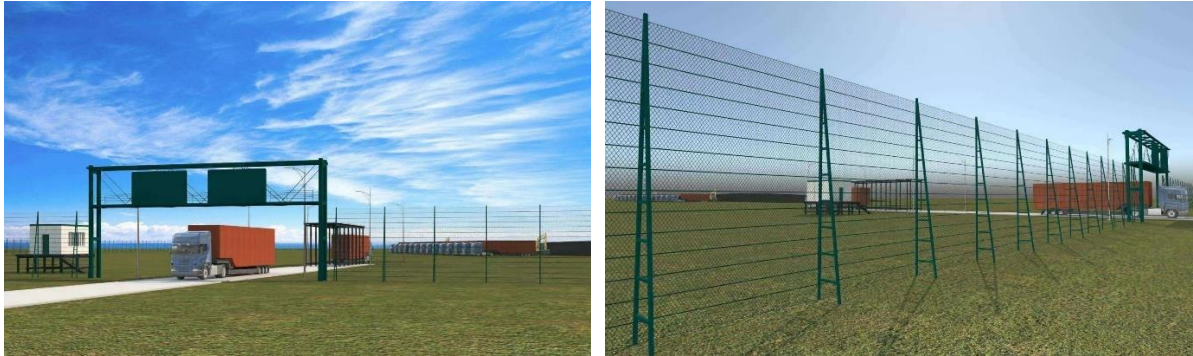
Зураг 1-2. Төслийн талбайн зураг төсөл

Ананд жим ХХК-ийн Гаалийн хяналтын талбай байгуулах төсөл нь барилга байгууламжийн хувьд гаалийн хяналтын талбайн хашаа, пүү, пүүний барилга зэргээс бүрдэнэ (Зураг 1-2).