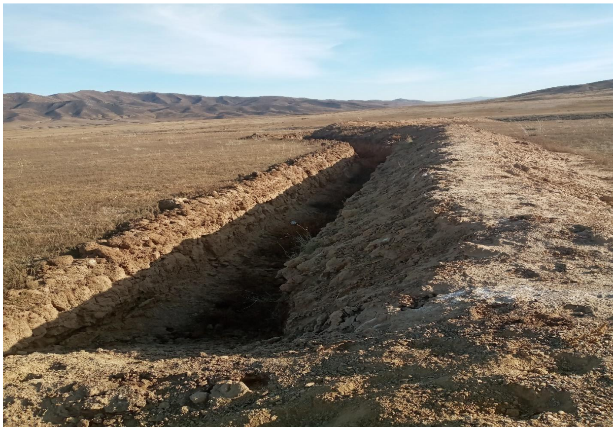
Зураг 3. Үерийн уснаас хамгаалах шуудуу