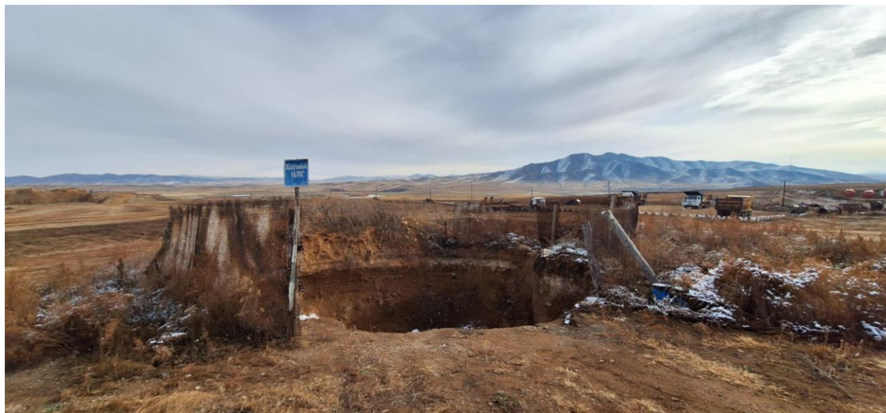
Зураг 13. Хог хаягдлын цэгийг тойруулан хашсан байдал