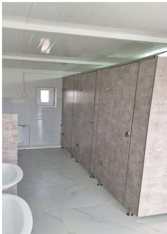
Зураг 14. Соруулдаг 00