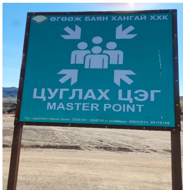
Зураг 4. Таних тэмдэгүүд