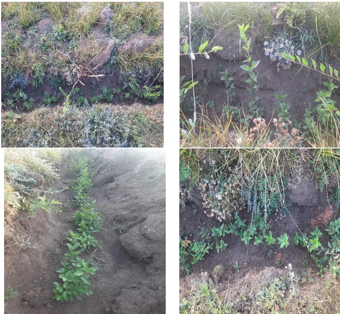
Зураг 15. Тэрбум мод хөдөлгөөн болон ойн салбар үүсэж хөгжсөний 100 жилийн ойн хүрээнд байгуулсан ногоон төгөлд хайлаас мод