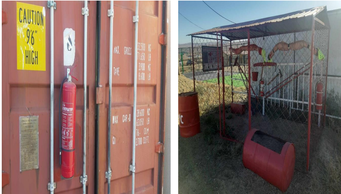
Зураг 9. Галаас хамгаалах хэрэгсэл байршуулсан байдал