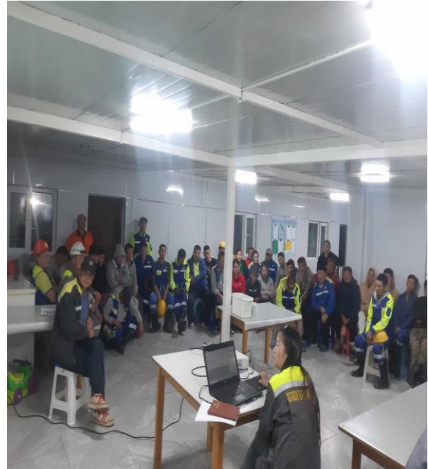
Зураг 12. ХАБЭА-н сургалт хийж байх үеийн зураг