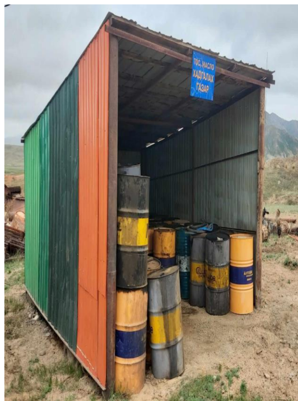
Зураг 14. Хэрэглэсэн тос масло хадгалах газар