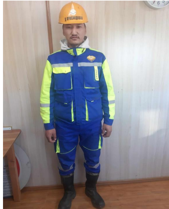
Зураг 11. Хөдөлмөр хамгааллын хувцас хэрэгслээр хангагдсан байдал