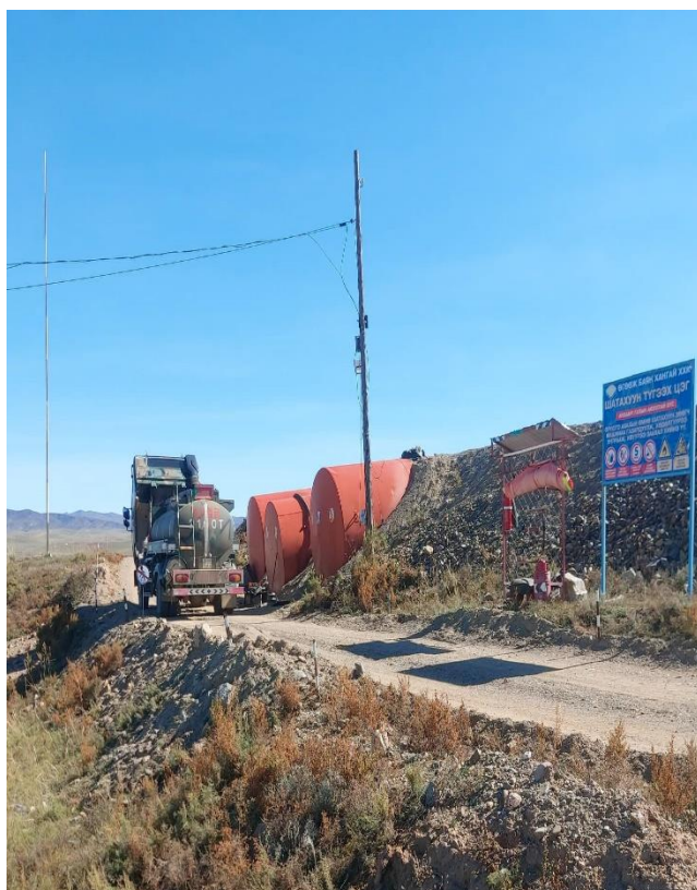
Зураг 5. ШТМ хадгалах ёнкос