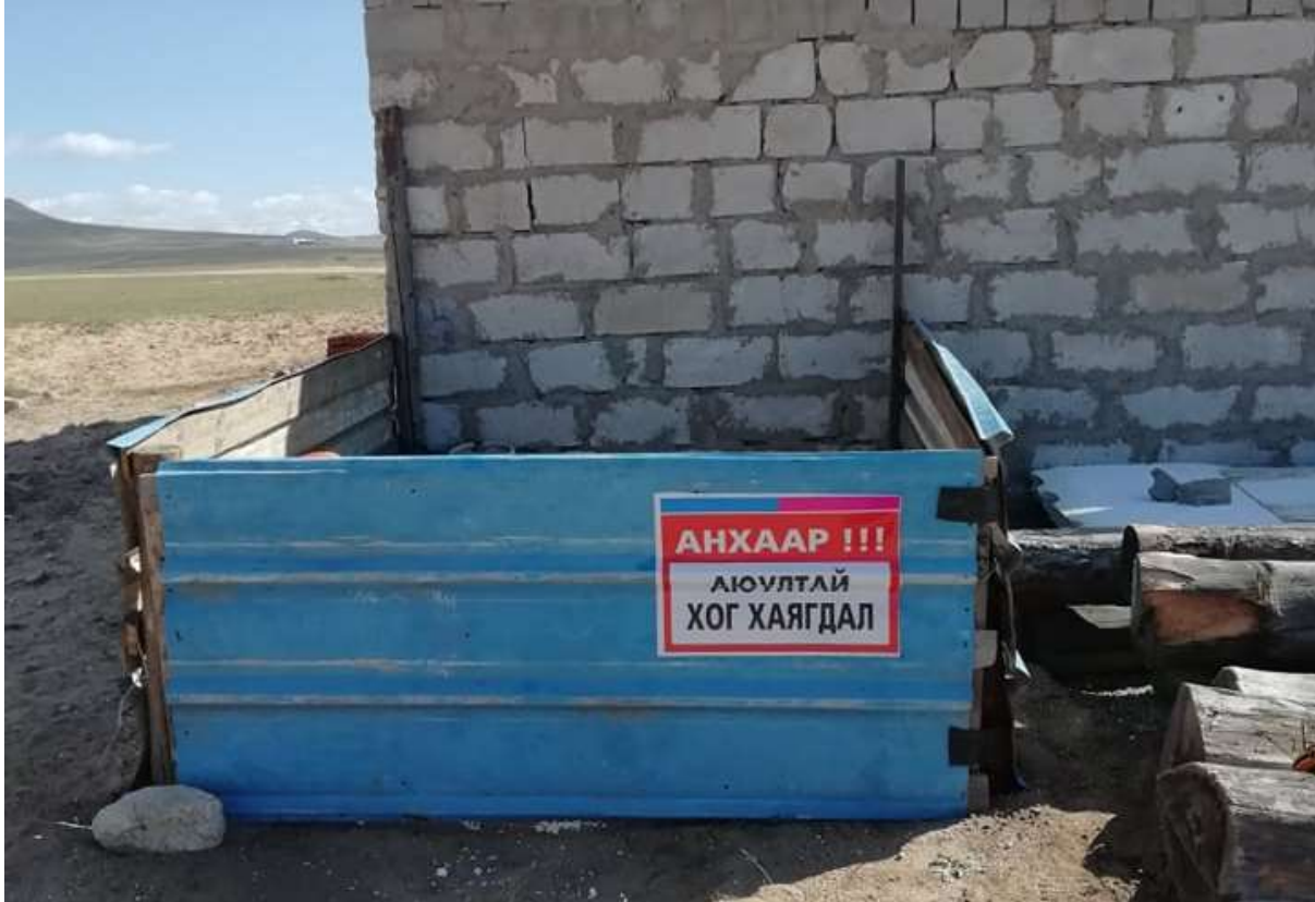
Зураг 5. Уурхайн талбайд байрлах аюултай хог хаягдлыг түр хадгалах цэг

Уурхайн үйл ажиллагаанд ямар нэгэн химийн бодис ашиглаагүй. Түүнчлэн өрөмдлөг тэсэлгээний ажил байхгүй болно. Уурхайн талбай дээр аюултай хог хаягдлыг түр хадгалах цэгийг байгуулсан.