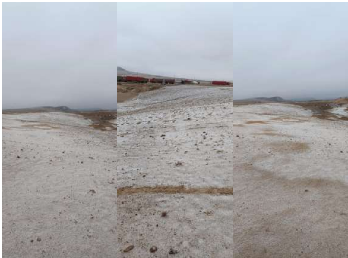
Зураг 3. Техникийн нөхөн сэргээлт хийсэн талбай

2024 онд нөхөн сэргээлтийн ажлын хүрээнд БОМТ-нд тусгасны дагуу 0.3 га талбайд техникийн нөхөн сэргээлт хийсэн.