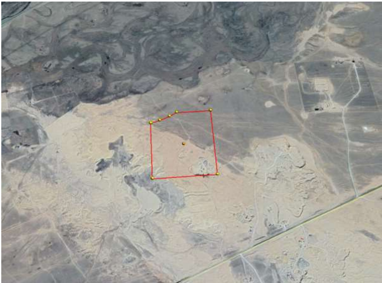
Зураг 1. “Зуун мод” элсний ордын байршлын зураг