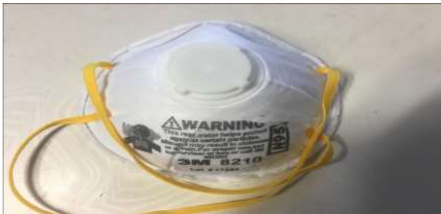
Зураг 13. Тоосноос хамгаалах хошуувч