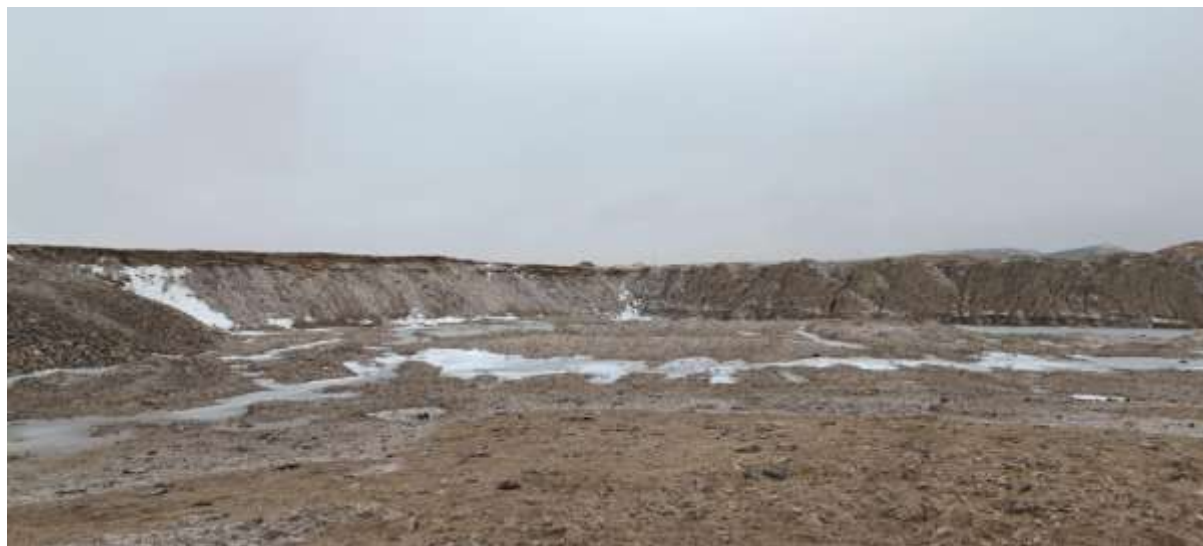
Зураг 2. Шимт хөрсний овоолго үүсгэн хадгалсан байдал