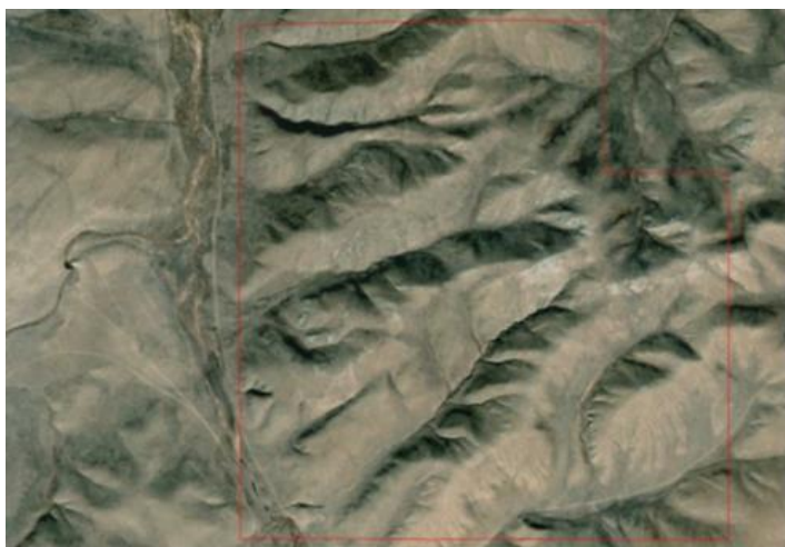
Зураг 1. Төслийн талбайн байршил