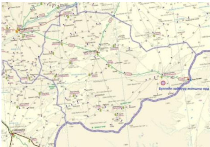
Тусгай зөвшөөрлийн талбайн координат

Төсөл хэрэгжих талбайн байршил: “Булаг” хайлуур жоншны орд ашиглах төслийн талбай нь Сүхбаатар аймгийн Эрдэнэцагаан сумын нутагт оршдог бөгөөд MV-020796А дугаартай уул уурхайн үйлдвэрлэл, ашиглалтын тусгай зөвшөөрөлтэй талбайд байрладаг. Төслийн талбай нь Улаанбаатар хотоос зүүн урагш 800 км, Баруун-урт хотоос 220 км, Эрдэнэцагаан сумын төвөөс урагш 25 км зайд байрлана.