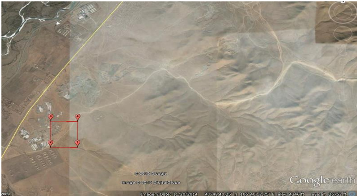
Зураг № 1 Төслийн талбайн байршил

MV-014382 тоот ашиглалтын тусгай зөвшөөрөл бүхий Элст-Хайрханы элс хайрганы холимогийн орд нь засаг захиргааны хуваариар Улаанбаатар хотын Хан-Уул дүүргийн нутагт 1:100000-ны масштабтай байр зүйн зургийн L-48 хавтгайд 31.46 га талбайг эзлэн оршино.