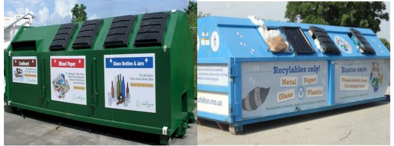
Зураг 2. Дахин ашиглах хог хаягдлыг ангилан ялгаж, түр хадгалах савын жишээ

Төсөл хэрэгжүүлэгч нь ангилан ялгасан, дахин ашиглах боломжтой хог хаягдлыг боловсруулах үйлдвэрүүдэд нийлүүлж хамтран ажиллах шаардлагатай. Харин төслийн үйл ажиллагаанаас гарах аюултай хог хаягдлыг БОАЖ сайдын 2018.01.30 өдрийн А/18 дугаар тушаалын 1-р хавсралтын дагуу Аюултай хог хаягдлыг тээвэрлэх, цуглуулах, хадгалах, дахин боловсруулах, устгах, экспортлох тусгай зөвшөөрөл авсан аж ахуйн нэгжүүдтэй байгуулсан гэрээний дагуу саармагжуулан, устгах.