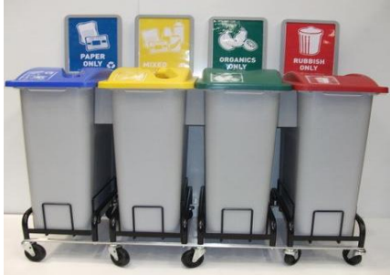
Зураг 1. Хог хаягдлын ангилал, зайлуулах арга

Ахуйн хог хаягдлыг хог хаягдлыг ангилах, ачих, цуглуулах технологид нийцсэн, галд тэсвэртэй материалаар хийгдсэн, хог хаягдал салхиар тархах, хур тунадасны ус хуримтлагдах, шүүрэл ялгарахаас сэргийлсэн ангилан ялгах зориулалтын сав байрлуулж хог хаягдлын цэгийн тохижуулах