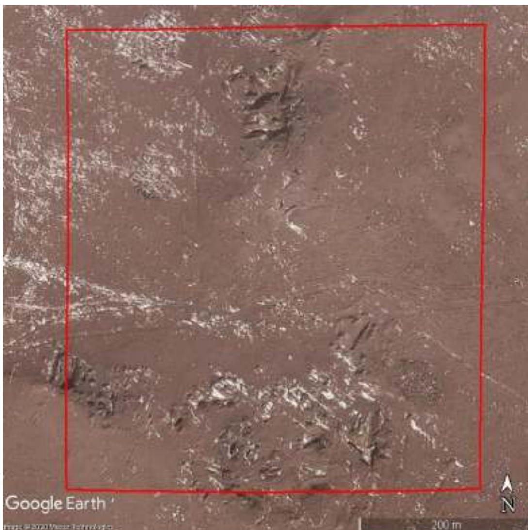
Зураг № 2. MV-017256 тусгай зөвшөөрлийн талбай