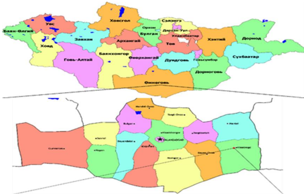
Зураг 1. Ордын физик газарзүйн байрлал

Уурхайн байршил: Оюу толгойн уурхай нь Өмнөговь аймгийн Ханбогд сумын Баян багийн нутагт харьяалагддаг бөгөөд Улаанбаатар хотоос урагш 720 км, Даланзадгад хотоос зүүн тийш 290 км, Ханбогд сумаас зүүн хойт зүгт 4,6 км зайд байрладаг.