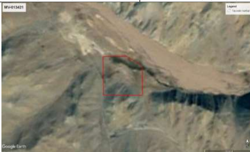
Зураг 1. Төслийн талбайн байршил