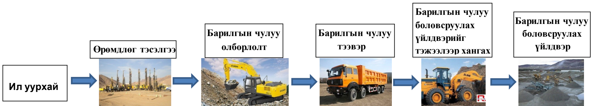
Зураг-1. Тоног төхөөрөмжүүдийн холболтын бүдүүвч