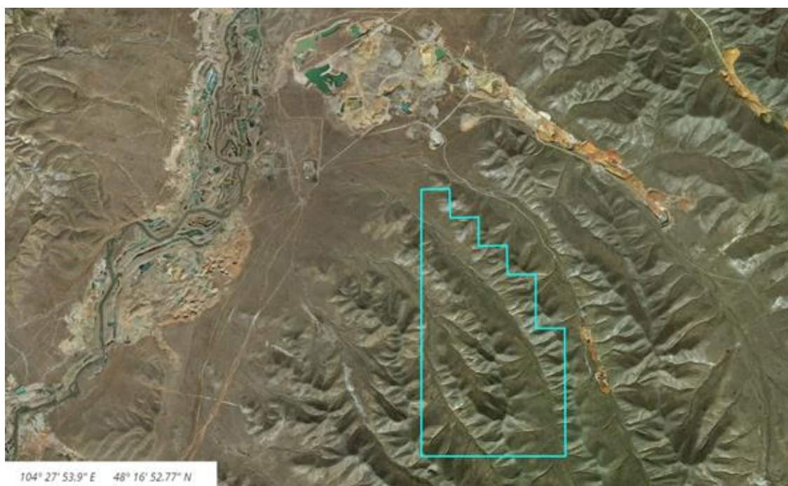
Зураг 1. MV-021470 тоот тусгай зөвшөөрлийн талбайн байршил.

Ашиглалтын тусгай зөвшөөрлийн талбай нь бүс нутгийн хувьд Хэнтийн нурууны баруун хойд хэсэгт, Заамарын нуруу, Туул голын ай сав газарт дэд бүтцийн тааламжтай нөхцөлд байрладагаараа онцлогтой. Хамгийн өндөрлөг цэг нь далайн төвшнөөс 1815 м-т байрлах Цагаан уул. Хамгийн нам дор газар нь талбайн төв хэсэгт - 1040 м. Харьцангуй өндөржилт нь Дунд наймганы хөндийн хамгийн ойр орших өндөрлөгтэй холбож үзэхэд 150-200 м-т хэлбэлзэнэ. Уул нуруудыг зааглаж буй хотгорууд нь сул хэрчигдсэн 950-1100 м өргөгдсөн гадаргуунууд бөгөөд зүүн хойш чиглэлтэй, 4-7 км-ийн өргөнтэй.