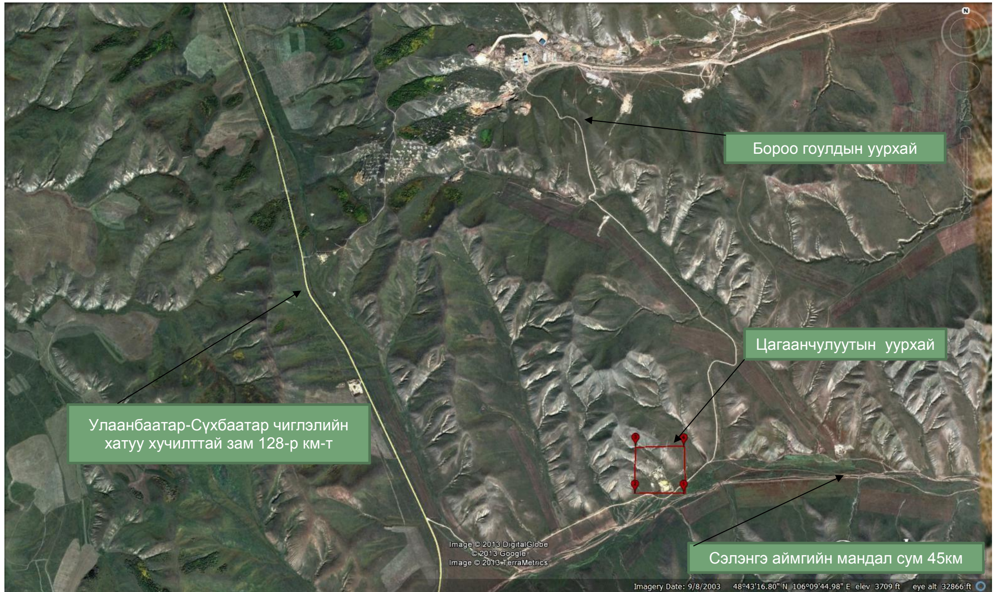
“Цагаан чулуутын” алтны үндсэн ордын тусгай зөвшөөрлийн талбайн байршлын зураг №-2