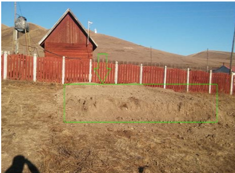
Зураг №6 Ахуйн шингэн хог хаягдалын цэг

Ажиллагсдын хоол үйлдвэрлэх явцад гарч буй шингэн хог хаягдлыг 3:2.5 м 2 харьцаатай зумфэнд цуглуулан хатуу хаягдлыг ялган шингэн хаягдлыг нэвчүүлнэ.