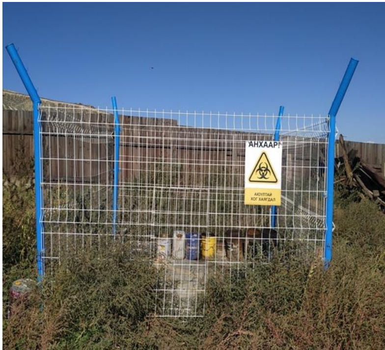
Зураг №5 Аюултай хог хаягдалын цэг.

3:3 харьцаатай бетонон шалтай сараалжаар хашсан аюултай хог хаягдлын цэг байгуулсан ба тос, масло, аккумулятор, тосны шүүр тэдгээрийн сав зэргийг бүртгэн авч аюултай хог хаягдлын цэгт төвлөрүүлж дахин боловсруулдаг ААН-д өгнө.