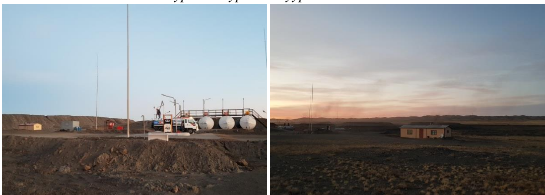
Зураг 3. Уурхайн шатахуун түгээх станц