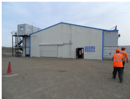
Зураг 1. Уурхайн захиргааны байр ба засварын төв

Уурхайн тосгон нь ордоос хойд зүгт 6 км зайд байрладаг. Тосгонд ажилчдын байр, гал тогоо хоолны заал, халуун усны газар, уурын зуух, материалын агуулах зэрэг барилга байгууламжууд байна.