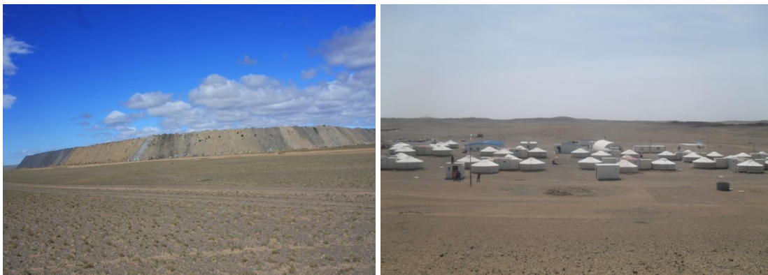
Зураг 2. Уурхай ба уурхайн тосгон