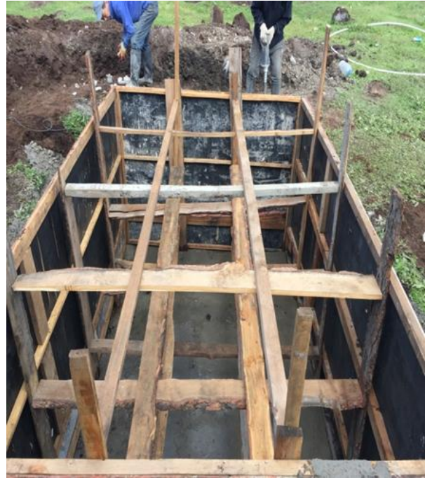
/7тн-ий ионгсийг суурилуулах бетон цутгаж буй хэсэг/