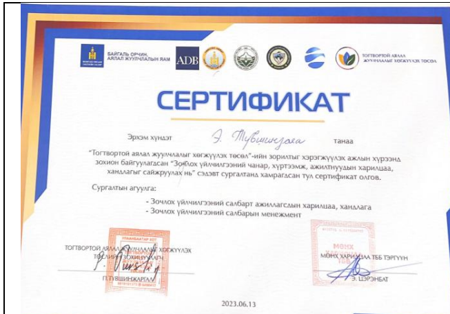
Ажилчдын сургалтад хамрагдсан сертификат