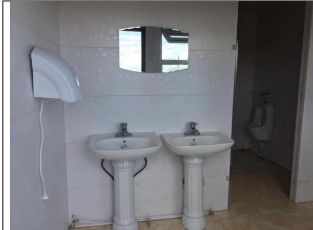
/Ариун цэврийн өрөө, угаалтуурын хэсэг/