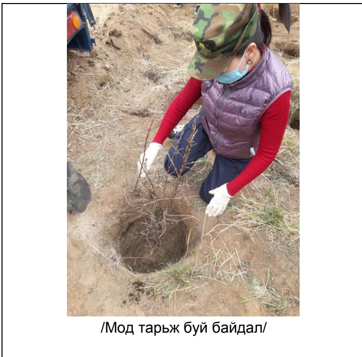
/Мод тарьж буй байдал/

/Орчны тохижилт цэцэрлэгжүүлэлтийн хүрээнд хийсэн ажлыг баталгаажуулах зураг/