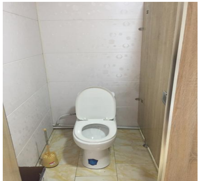
/Маргад жуулчны баазын ариун цэврийн хэсэг/