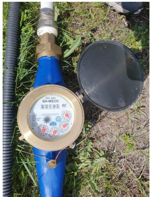
/Цэвэр усны тоолуур сууриллуулсан байдал/