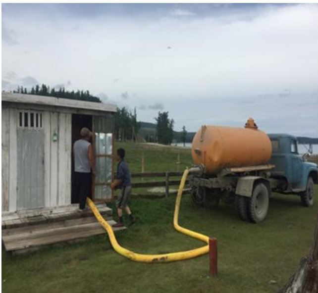
/Гэрээний дагуу бохир усаа соруулуулж буй байдал/