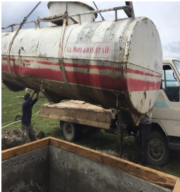
/Ариун цэврийн байгууламж суурилуулж буй байдал/