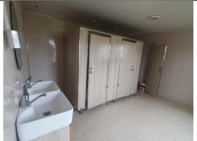
/Эмэгтэй ариун цэврийн өрөө/