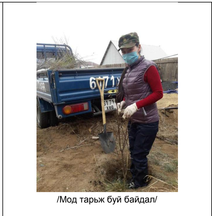
/Мод тарьж буй байдал/