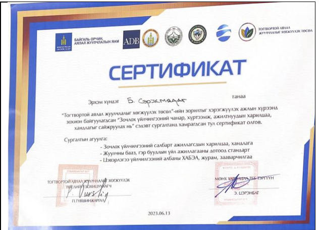
Ажилчдын сургалтад хамрагдсан сертификат