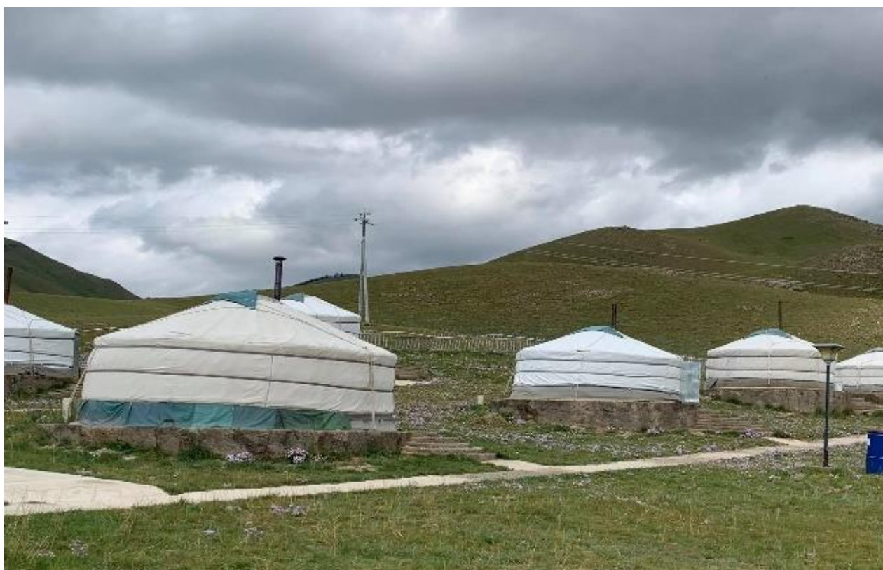
Зураг 3. Явган хүний зам

Төслийн талбайн тээврийн хэрэгслийн зогсоолын хайрган хучилт багассан тул амрагчдын автомашин хүний хөдөлгөөнөөр газрын гадарга нөлөөлөлд өртөх магадлалтай Төслийн талбай дахь явган хүний зам болон тоглоомын талбай, барилга орчмын талбай нь