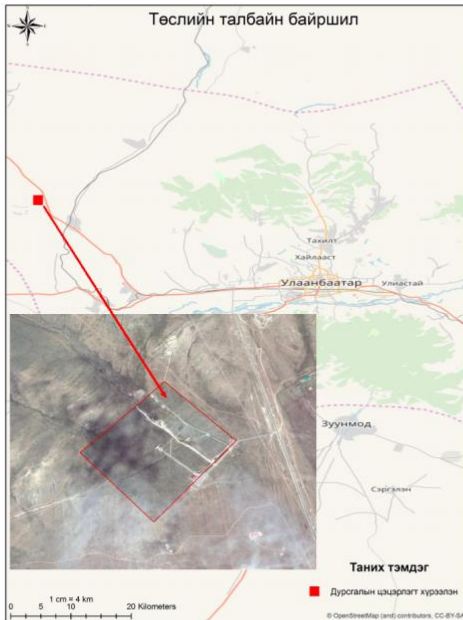
Зураг 1. Дурсгалын цэцэрлэгт хүрээлэнгийн байршил

Төсөл хэрэгжиж буй талбай нь СХД-ийн 21-р хорооны нутаг болох Шүлэгт уулын энгэрт буюу Улаанбаатар-Дархан чиглэлийн зам дагуу Улаанбаатар хотоос баруун хойд зүгт 49 км зайд байрлана.