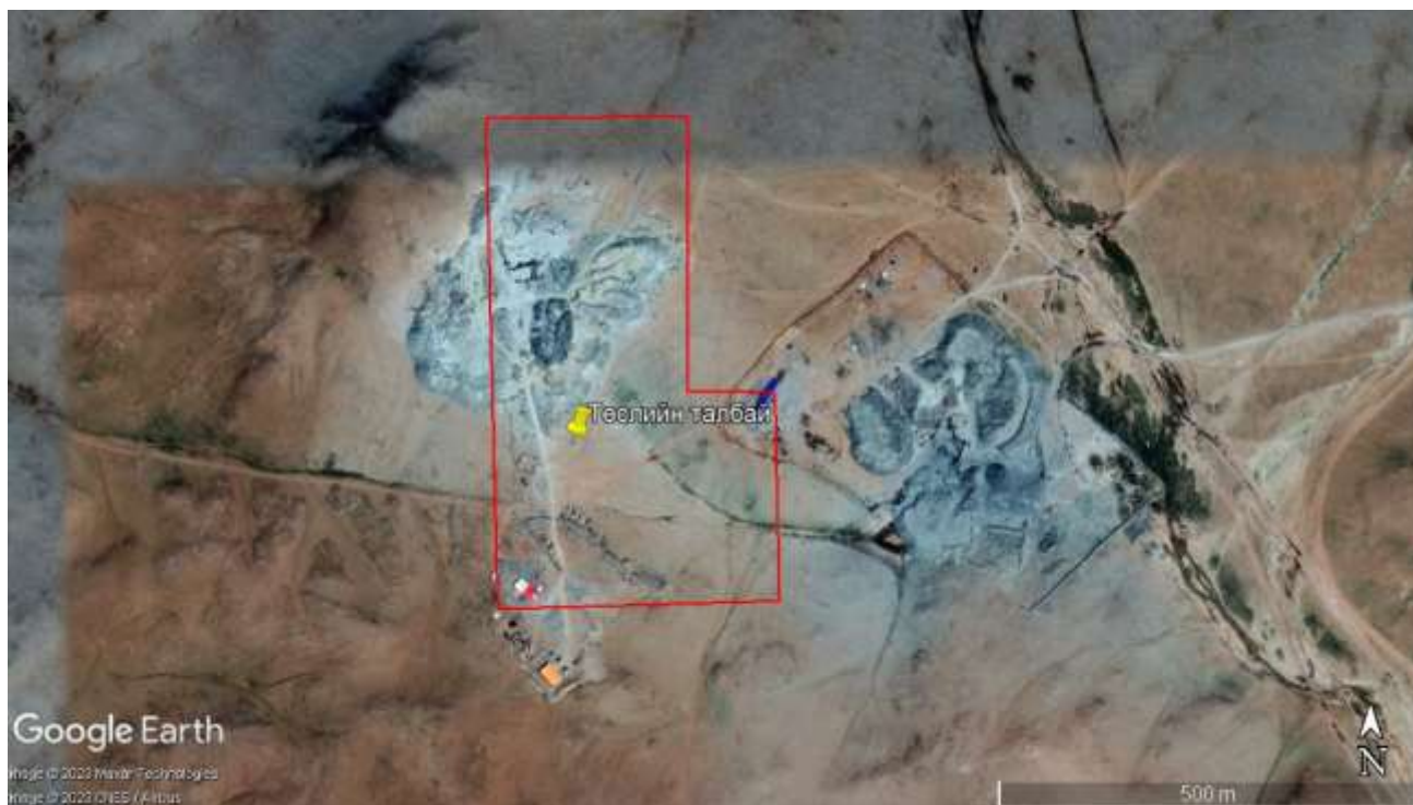
Зураг 2. Төслийн талбайн байршилн агаар, сансрын зураг