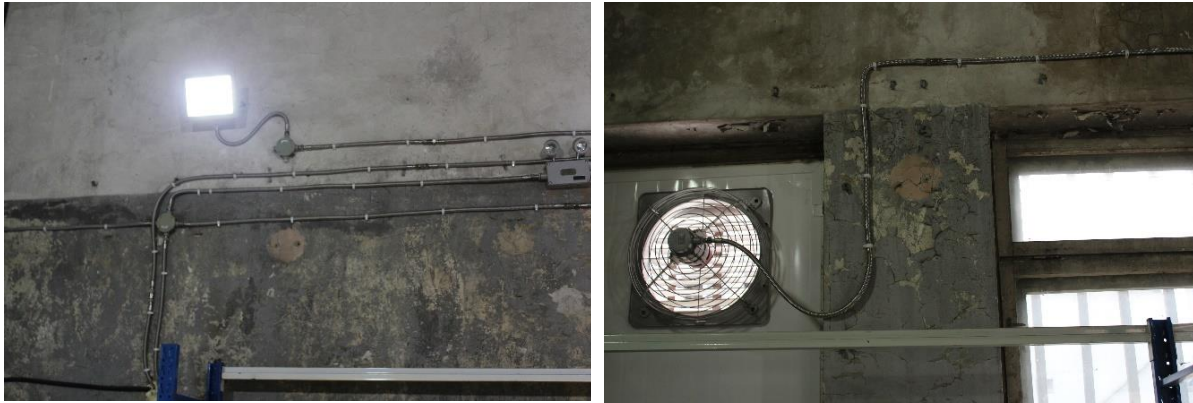
Зураг 1-11. Химийн бодисын агуулахын агааржуулалт