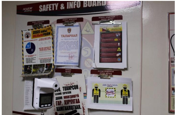
Зураг 1-4. Оффисын анхны тусламжийн хайрцаг, аюулгүй ажиллагааны самбар