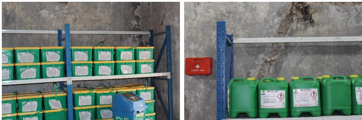
Зураг 1-10. Химийн бодисын сав баглаа боодол

Химийн бодисын агуулахын тавиур, бодисын сав баглаа боодол нь Химийн хорт болон аюултай бодис хадгалах, тээвэрлэх, ашиглах, устгах журамд (Монгол улсын шадар сайд, байгаль орчин, аялал жуулчлалын сайд, эрүүл мэндийн сайдын 2017 оны 05дугаар сарын 23-ны өдрийн 54/А/136/А/215 дугаар хамтарсан тушаалын хавсралт) заасан химийн бодисын тавиур нь доорх шаардлагыг хангаж байна. Тухайлбал: