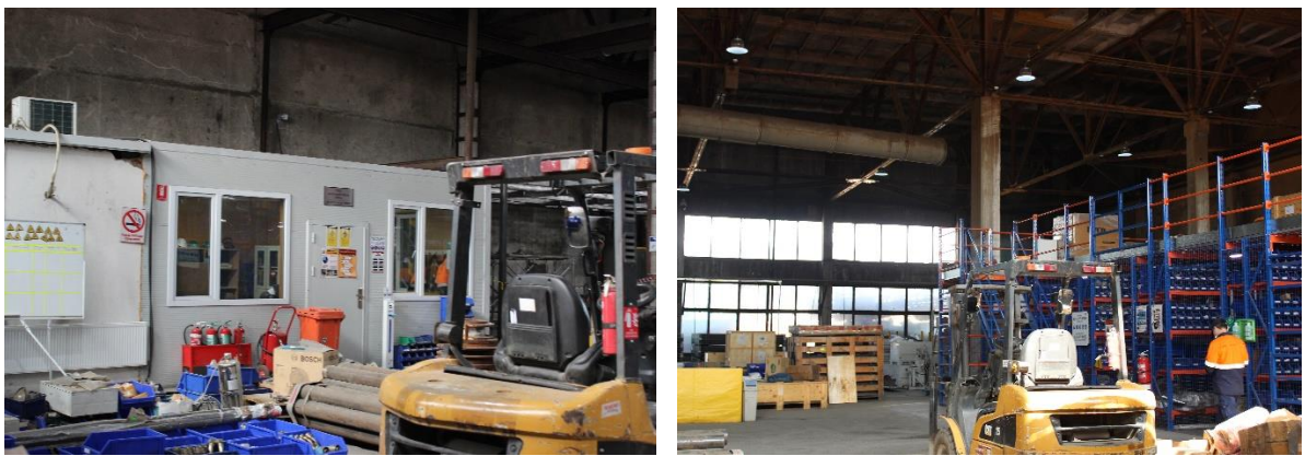
Зураг 1-12. Засварын цех