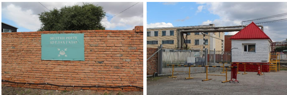
Зураг 1-8. Оффисын гадна байрлах цуглах газар