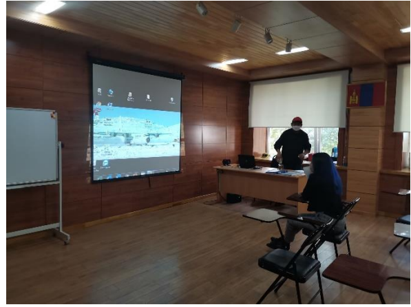
Зураг 1-3. Аюулгүй ажиллагааны зааварчилгаа өгөх танхим