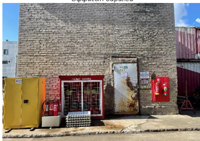
Химийн бодисын агуулах