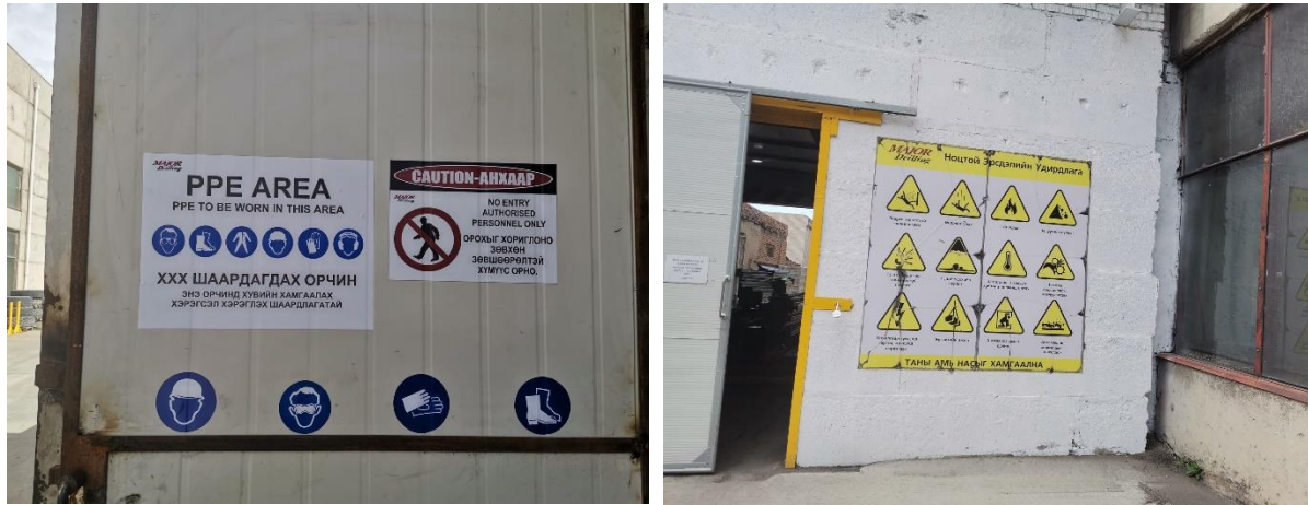
Зураг 1-9. Аюулгүй ажиллагааны зааварчилгаа

гадаргуутай, анхааруулах тэмдэг, дохио үг, санамж болон шаардлагатай үед холбоо барих утасны жагсаалтыг ил байршуулсан байна.