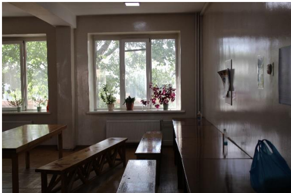
Ажилчдын цайны газар