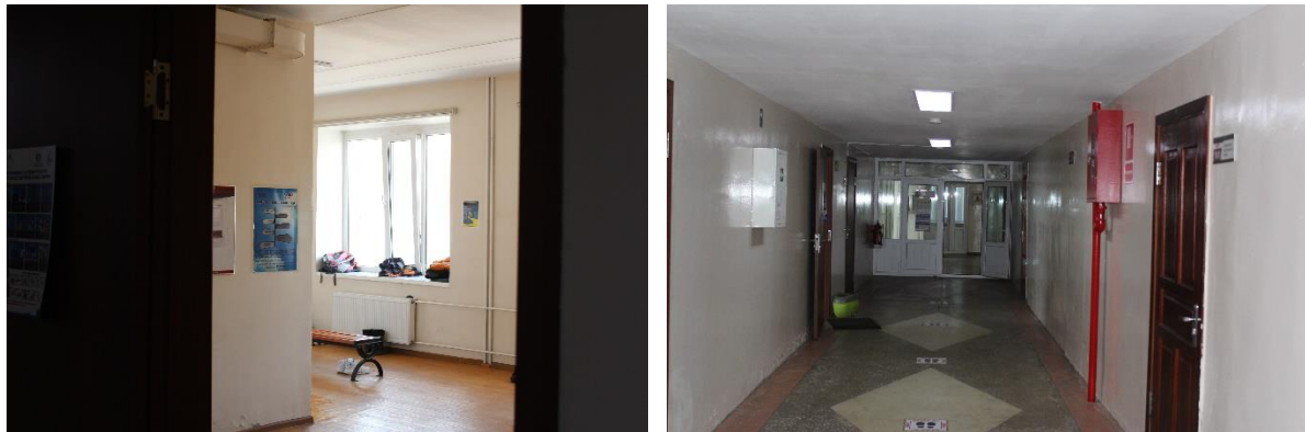
Зураг 1-7. Ажилчдын хувцас солих өрөө