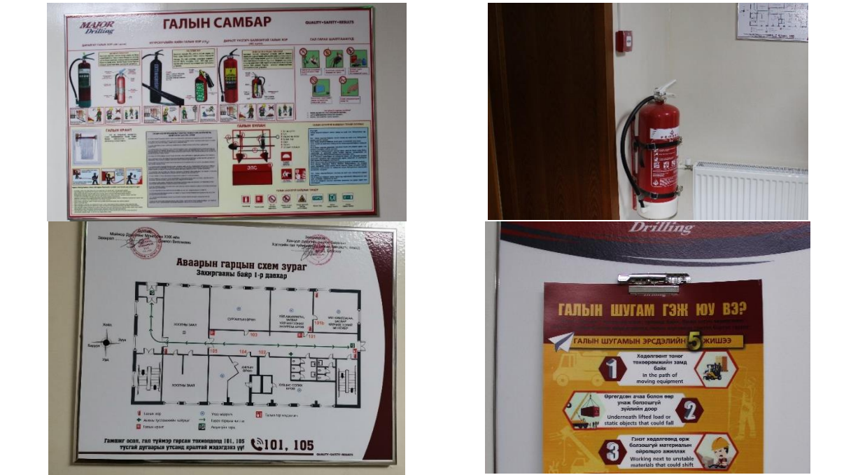
Зураг 1-6. Оффис доторх галын булан