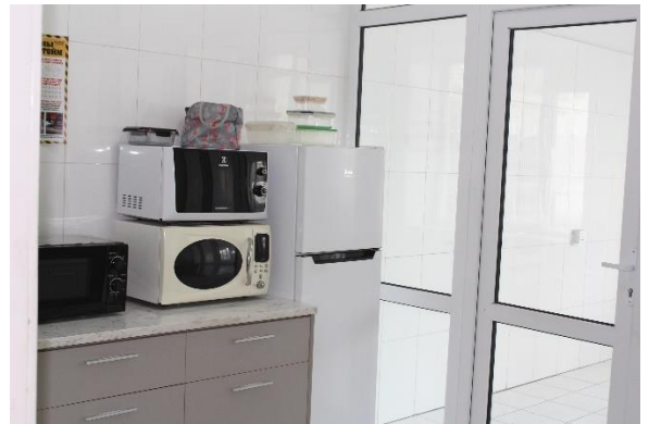
Ажилчдын гал тогоо