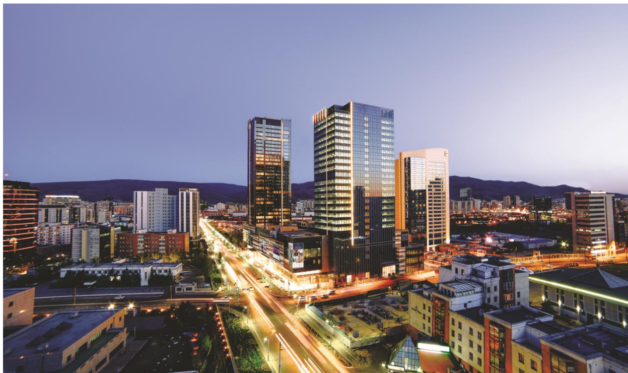
Зураг 1. Шангрила

Гадаадын хөрөнгө оруулалттай “Шангрила-Улаанбаатар хотел” ХХК нь Дэлхийн томоохон хотуудад 100 орчим сүлжээтэй Шангри-Ла төв нь 5 одтой зочид буудал, А зэрэглэлийн оффис, худалдааны төв, тансаг зэрэглэлийн орон сууц, бүрэн тоноглогдсон спорт клуб хүүхэд багачуудад зориулсан адал явдлын бүс буюу тоглоомын төв зэргээс бүрдсэн 400 орчим автомашины зогсоолтой цогцолбор бүтээн байгуулалт бөгөөд худалдааны төв, оффис, тоглоомын төв, орон сууц, спорт клуб, зочид буудал зэрэг үйл ажиллагаа явуулдаг.