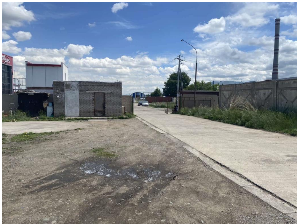
Зураг 2. Агуулахын хашаан дотор авто машин зорчих хэсэг