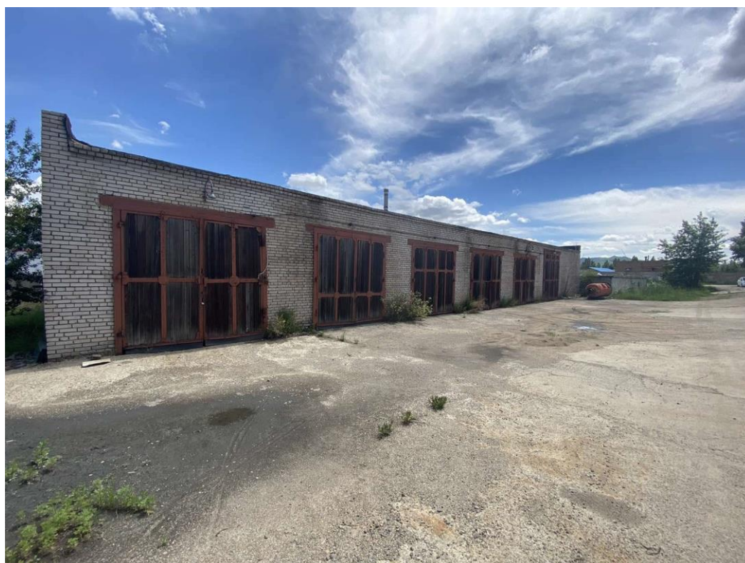
Зураг 3. Химийн бодис хадгалах агуулах, 6-н тусгаарлах хэсэг

Төсөл хэрэгжих агуулахын байршил нь Баянгол дүүргийн 20-р хорооны нутаг дахь үйлдвэрийн бүсэд байрлах бөгөөд ДЦС-4-ийн баруун хойно, толгойт өртөөний салаа төмөр замын агуулахын байрнаас 500 метр зайд байрладаг.